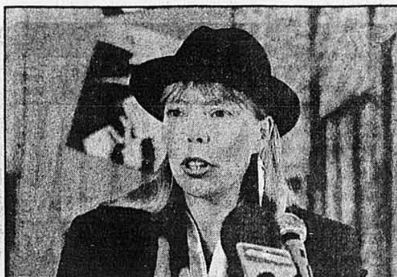
Joni Mitchell, en conférence de presse hier à Montréal.

Une tournée en prévision? « Cet automne peut-être. Mais il n'y a rien de finalisé ».