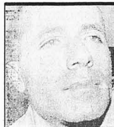
Mordechai Vanunu

Il était impossible d'entrer en contact hier avec le « Comité du Karabakh » organisant les manifestations arméniennes. Les liaisons téléphoniques, habituellement bonnes, fonctionnaient mal et par intermittence.