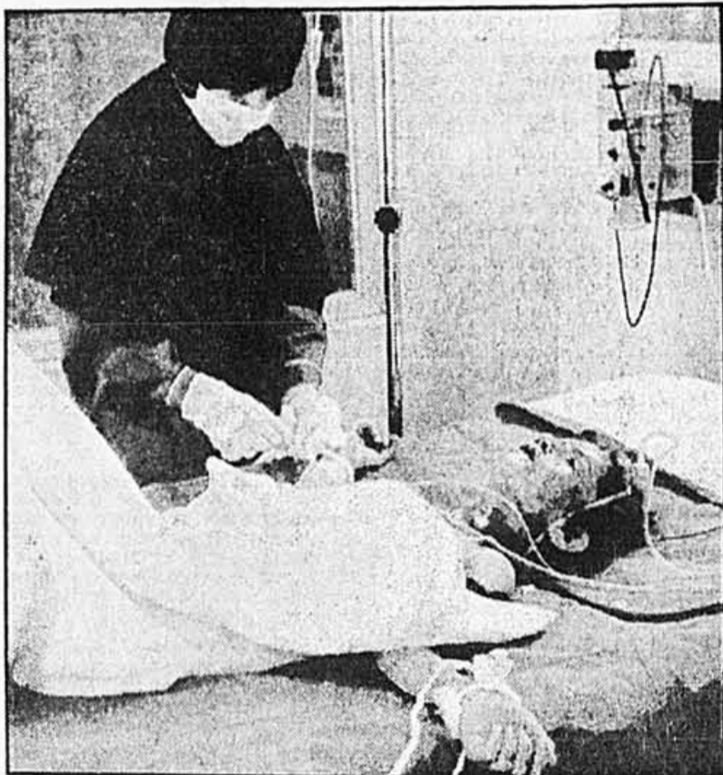
Cet homme soigné dans un hôpital iranien aurait été victime d'armes chimiques utilisées la semaine dernière dans la guerre qui sévit entre l'Irak et l'Iran.