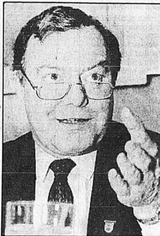
Robert de Cotret