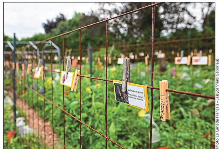
Le potager de Semences des artisans compte environ 300 variétés de tomates. Celles qui sont cultivées depuis plus longtemps sont identifiées par une fiche, tandis qu'une épingle permet d'identifier les nouveaux cultivars.