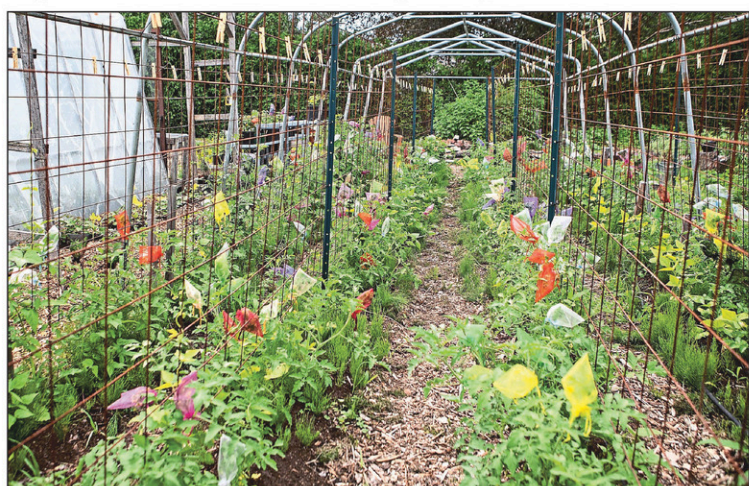
Les sacs d'organza multicolores donnent au potager l'allure d'un sapin de Noël! Ces sacs permettent d'éviter la pollinisation croisée.