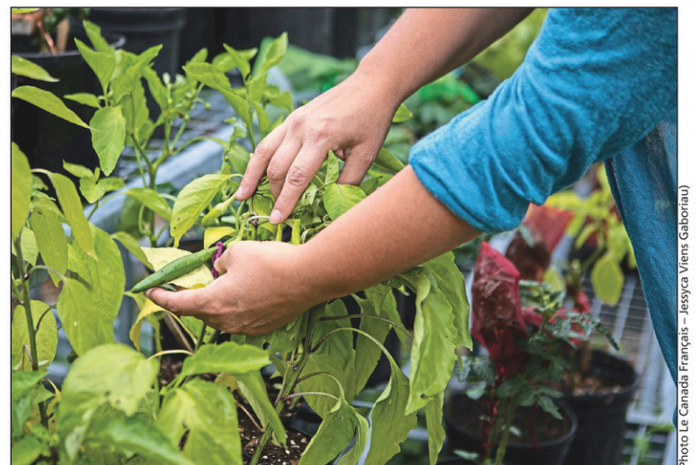
Une cordelette identifie les semences qui seront prélevées. C'est le sort réservé aux graines de ce piment fort.