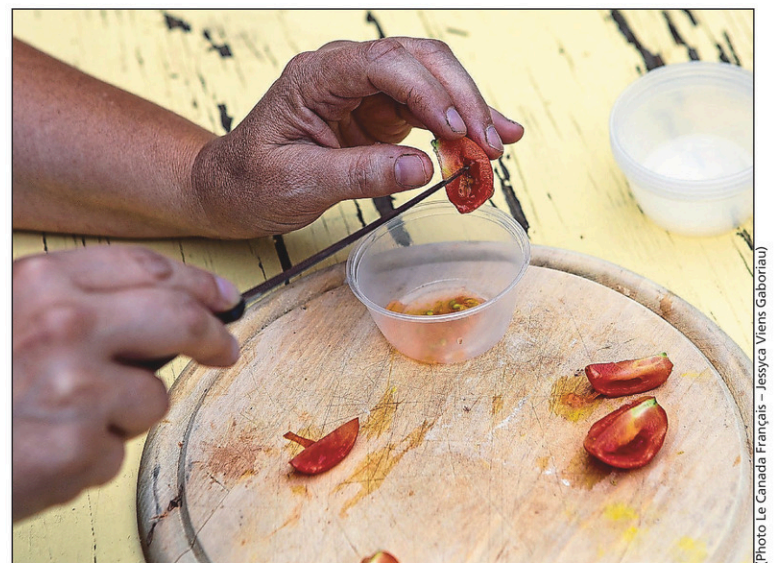
Une fois prélevées manuellement, les semences de tomates sont fermentées. Ce processus permet d'éliminer certaines maladies.