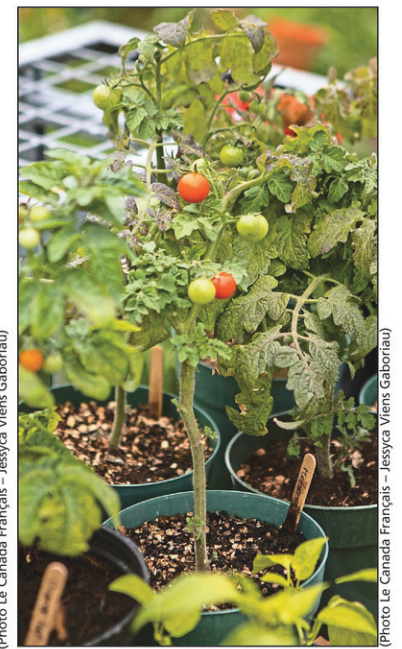
Des plants de tomates micronains.

Une dame, dont le nom est inconnu, la cultivait depuis plusieurs années lorsqu'elle aurait fourni un spécimen à M. Fowler en 1978 qui l'a pérennisée.