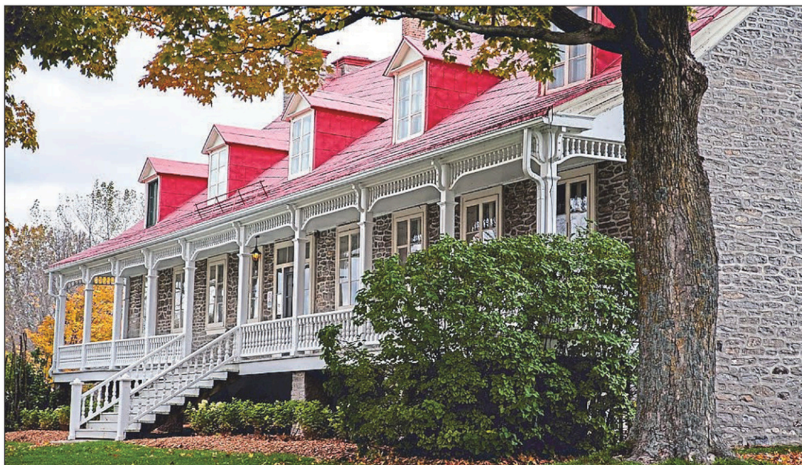
Le presbytère de L'Acadie est l'un des édifices anciens les plus imposants de la Montérégie. Il connaîtra en 1955 une importante restauration de ses murs extérieurs, puis fera l'objet d'un classement par un arrêté ministériel le 2 décembre 1964.

Ce n'est toutefois que le 7 octobre 1821 que la seigneurie de Léry obtient la permission, par un décret de M re Plessis, de s'ériger en paroisse sous l'invocation de saint