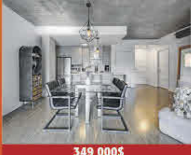
349 000$ Montréal

Fermette intergénérationnelle (côte-à-côte) avec terrain boisé & paysager au bord de l'eau. Terrain de plus de 170 000 pi 2 . Grange (tôle & bois) de 3 728 pi 2 , piscine, 3 chambres & patio. Chauffe-eau, thermopompe & toiture 2014. Accès à la salle à manger à partir de la terrasse arrière, accès au sous-sol à partir du salon et accès extérieur à partir de la salle familiale.