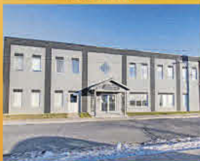
1 129 000$ Sorel-Tracy

Charmante propriété de 2 chambres à coucher, rénovée tout en ayant conservée ses boiseries d'origine, lui permettant de conserver son look champêtre. Située à proximité des écoles et des services, elle vous offre une jolie cour arrière clôturée. Au 2e étage se trouve un ancien logement laissé vacant depuis quelques années. Belle opportunité!