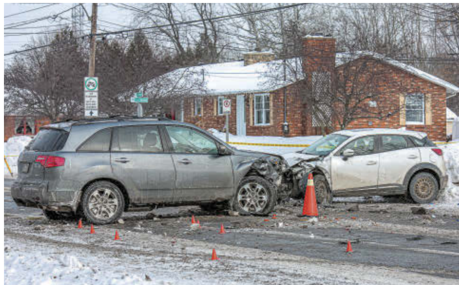
Une collision impliquant quatre véhicules s'est produite sur le chemin des Patriotes, à la hauteur de la rue de la Savane, le 25 janvier, vers 8 h.