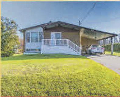
289 000$ Saint-Robert