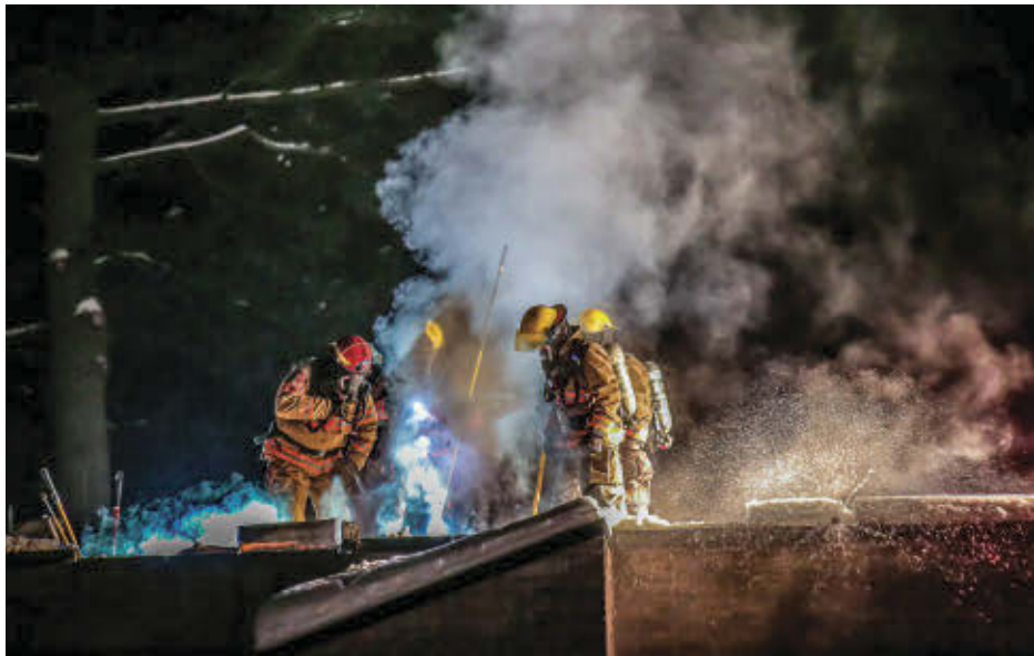
Un incendie de cheminée a été rapidement pris en charge par les pompiers de Sorel-Tracy, le 24 janvier, afin d'éviter qu'il se propage à l'entièreté de la maison.