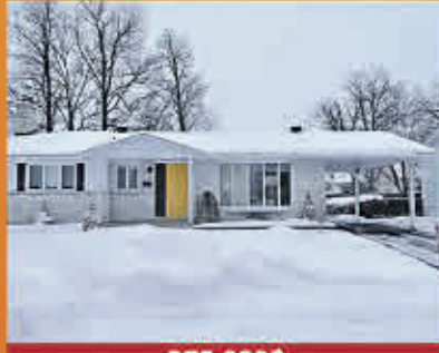
275 000$ Sorel-Tracy

Projet rénovation! Travaux de fondation effectués en 2019. L'ancien vendeur a fait lever la propriété et l'a fait poser sur une nouvelle fondation. Il a aussi remplacé la solive de rive. Les logements sont à relaire, car ils ont été entièrement démolis. Idéal pour en créer la propriété de vos rêves!