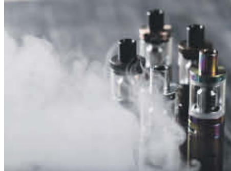
Près de 300 vapoteuses, fioles ou recharges de contrebande ont été saisies à Sorel-Tracy le 27 janvier.

Coordonné par le ministère de la Sécurité publique, le programme ACCES Tabac (Actions Concertées pour Contrer les Économies Souterraines) est une initiative gouvernementale mise en place en 2001 destinée à contrer le commerce illégal de