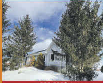
599 000$ Saint-Ours

Belle propriété comprenant 2 chambres à coucher. Sous-sol à air ouverte. Possibilité de faire une autre chambre. Située près de plusieurs services essentiels et tout près de l'autoroute 30. Au plaisir de vous faire découvrir cette demeure!