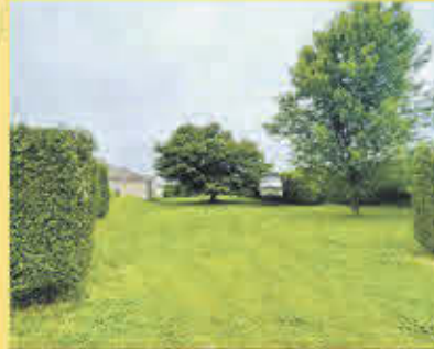
79 000$ Sorel-Tracy

Maison neuve 2021 style Farmhouse avec vaste garage de 24 x 26 pieds. Tout l'espace est efficacement utilisé. Cour intime, une partie clôturée et l'autre bordée par des haies avec beau trottoir de béton à l'avant. Clé en main au goût du jour dans une rue tranquille. Venez visiter rapidement!