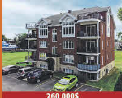
260 000$ Sorel-Tracy

Magnifique condo à aire ouverte, rare et recherché, faisant partie du Carré SOHO phase III construction 2015. 700 pc de luminosité avec grand balcon de 22,8 x 7 pi et vue sur la cour aménagée en jardin zen. Propriété immaculée, repeint en 2021, hauts plafonds en béton de 9pi. Superbe terrasse commune sur le toit avec vue panoramique. Il a tout pour vous plaire!