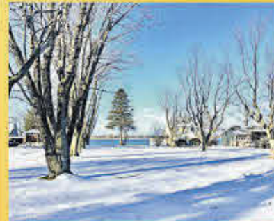
499 000$ Sorel-Tracy

Immeubles à revenus incluant deux grands logements dont un 7 1/2 et un 5 1/2. À distance de marche de tous les services dont des restaurants, transport en commun, épicerie, piste cyclable, etc. Les deux logements sont présentement occupés.