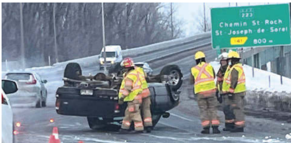
Un véhicule de type pick-up a effectué un capotage sur l'autoroute 30, provoquant la fermeture du pont Maurice-Martel en direction ouest le 27 janvier.

Un homme a été légèrement blessé et transporté au centre hospitalier. Dans l'autre accident, la conductrice n'a pas été blessée et elle a pu repartir avec son véhicule. La chaussée glissante pourrait être en cause, mais aucune hypothèse n'est écartée.