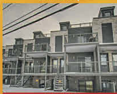
249 000$ Contrecoeur

Maison de campagne avec 5 chambres à coucher et beaucoup d'espaces sur un énorme terrain de 3,72 arpents en zone agricole cultivable. Garage de 19 x 26 pieds. Vaste stationnement. Présentement louée. À seulement 25 minutes de Saint-Hyacinthe. Bienvenue aux amoureux de la campagne et de l'agriculture!