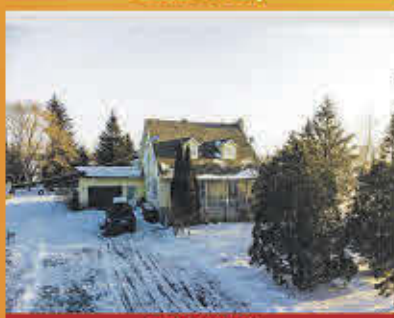
299 000$ Saint-Marcel-de-Richelieu

Jolie maison au centre-ville rénovée au goût du jour au fil des ans avec solarium plein soleil. À distance de marche de tous les services. Présentement louée. Beau terrain aménagé et situé sur un coin de rue avec arbres matures et galerie avant et arrière. Venez visiter!