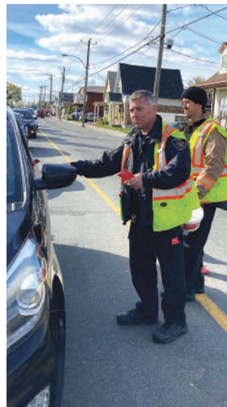
Les pompiers de Sorel-Tracy ont sollicité les citoyens de la région le 23 octobre 2021 pour amasser des fonds pour la Fondation des pompiers du Québec pour les grands brûlés.