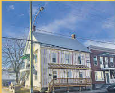
269 500$ Sorel-Tracy

Duplex de 4 1/2 vacant en plein centre-ville. Près de tous les services dont restaurants, hôpital et transport en commun. Vente et occupation rapides. Revêtement de la toiture refait en 2013. Bienvenue aux investisseurs et propriétaires occupants.