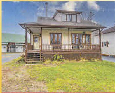
199 000$ Pierreville

Charmante maison constituée de 3 chambres, un abri-auto et beaucoup d'espaces sur un terrain de plus d'un arpent où se situe une grange de 39'2 x 20 pi et un garage de 20 x 13'10 pi. La tranquillité de la campagne à 10 minutes de Sorel-Tracy. Ne tardez pas à venir la voir!