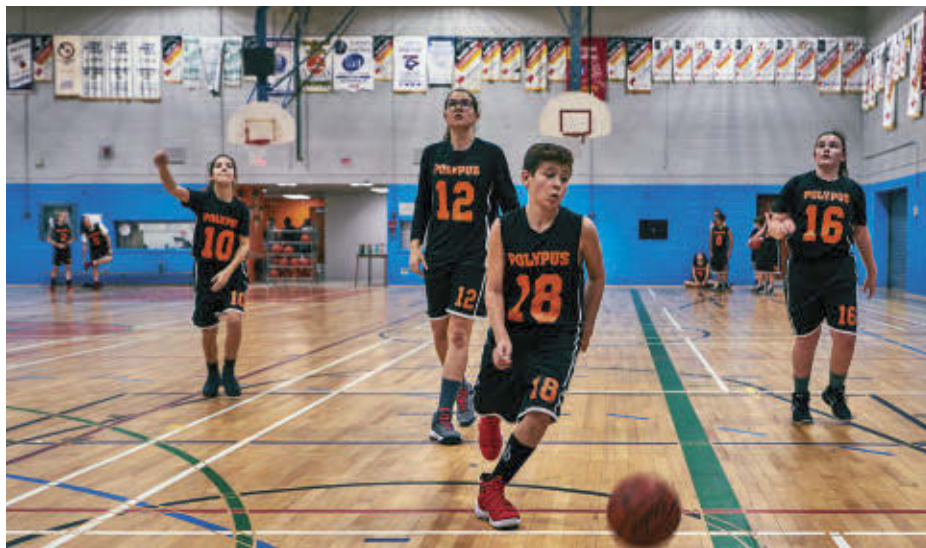
Les étudiants-athlètes des Polypus, dont ceux qui évoluent en basketball, ont retrouvé leurs coéquipiers en gymnase lundi.

Les élèves du Centre de services scolaire (CSS) de Sorel-Tracy peuvent aussi recommencer à pratiquer leur sport favori en gymnase, autant les membres des Polypus que les élèves qui pratiquent des activités parascolaires. « Toutes les activités parascolaires devraient reprendre [le lundi 31 janvier] dans le respect des consignes sanitaires