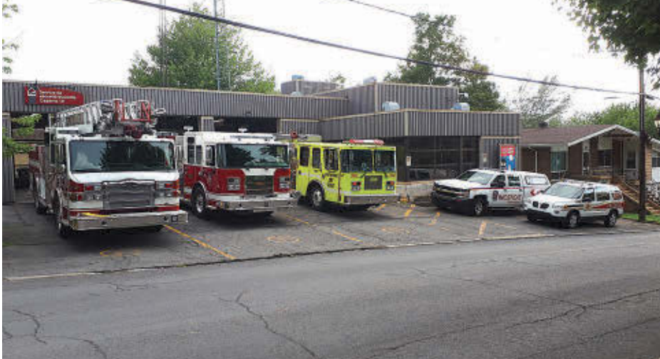
La caserne actuelle, sur la rue Saint-Antoine, n'est pas adaptée pour répondre aux besoins à long terme de la Ville de Contrecoeur.