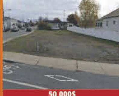
50 000$ Sorel-Tracy

Exceptionnel condo offrant vue sur l'eau, tout près de la rivière et d'une forêt protégée! Coûts d'énergie minimes dus au chauffage au gaz naturel. Chauffage et climatisation centraux + foyer. Belle finition, planchers de bois d'ingénierie ainsi que deux grandes chambres à coucher. Stationnement juste devant. Jolie terrasse, grandes pièces. Le luxe abordable. Et occupation possible dans un court délai! Vous pourriez même acheter les meubles.