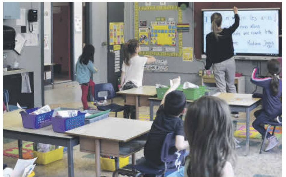
Depuis le 17 janvier dernier, tous les élèves du CSS de Sorel-Tracy sont de retour à l'école en présentiel (photo prise en mai 2020).

De plus, le personnel scolaire fait maintenant partie de la liste des travailleurs priori-