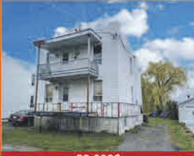
89 000$ Yamaska

Exceptionnel condo de en main avec vue sur le fleuve situé au cœur de Contrecoeur. Bel appartement dans un immeuble de copropriété situé au rez-de-jardin comprenant 2 chambres à coucher. Disponible rapidement, présentement vacant. Logement haut de gamme avec finition supérieure, foyer décoratif électrique, climatisation et chauffage central, bain et douche séparés, comptoirs de quartz et balcon intime. Venez découvrir votre prochaine demeure!