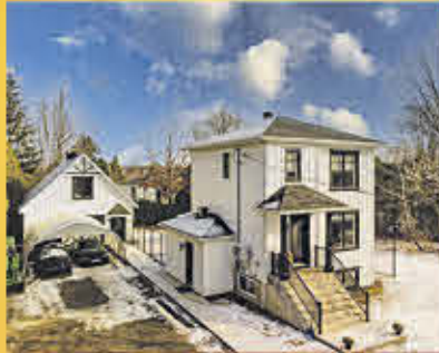
499 000$ Saint-Roch-de-Richelieu

Petit havre de paix à prix abordable au bord de la rivière Richelieu. Cette charmante propriété comprend 2 chambres à coucher. Habitable à l'année ou comme chalet. Peut aussi être intéressant comme projet de rénovations ou locatifs! À découvrir!