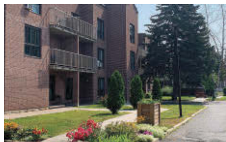
Des rénovations majeures auront lieu aux Jardins fleuris de Contrecoeur, un HLM situé au 5095, rue Legendre.

La Société d'habitation du Québec (SHQ) a octroyé un montant de 3 170 000 $ à l'OMH Marguerite-d'Youville pour réaliser des travaux cruciaux pour deux de ses immeubles. L'un d'entre eux est l'habitation Les Jardins fleuris de Contrecoeur, qui reçoit 1 850 000 $ pour moderniser l'ascenseur, remplacer des portes extérieures et effectuer divers travaux intérieurs et extérieurs.