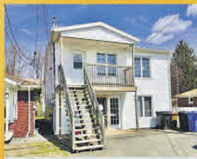
219 000$ Sorel-Tracy

Propriété comprenant 32 chambres présentement vacantes. Plusieurs services à proximité. Idéal pour refaire une résidence de personnes âgées. Plusieurs salles d'eau et salles de bains dans l'immeuble.