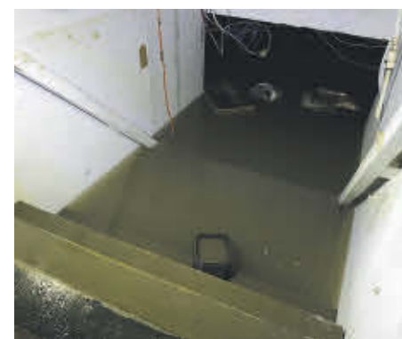
Un dégât d'eau majeur est survenu au restaurant Le Fougasse, forçant une fermeture prolongée.

Avec une estimation de 80 millions de litres d'eau et des tonnes de sable qui se sont ramassés en quelques heures dans son sous-sol, le restaurant Le Fougasse n'a pas pu rouvrir le lundi 31 janvier. Des travaux majeurs devront être faits et un plan B est déjà envisagé pour continuer d'opérer.