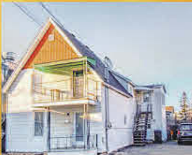
139 000$ Sorel-Tracy

Vaste terrain parfait pour établir domicile. Beaucoup de services sont accessibles à pied tels que des restaurants, boutiques, une pharmacie et des dépanneurs. Une belle occasion à ne pas manquer.