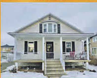
179 000$ Sorel-Tracy

Grand terrain sur le bord du fleuve Saint-Laurent de plus de 25 500 pieds carrés. Il y a l'aqueduc et les égouts de la municipalité qui restent simplement à raccorder. Situé près de plusieurs services tels que des restaurants, épicerie, dépanneur, écoles et bien d'autres. Admirez des couchers de soleil incomparables. Opportunité rare!