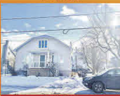
219 000$ Sorel-Tracy

Duplex très lumineux avec beaucoup d'espace constitué d'un 5 1/2 et d'un 4 1/2. Les deux locataires semblent vouloir rester. Bien situé, tout près de tous les services à distance de marche.