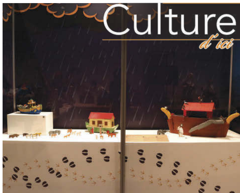
L'exposition « L'Arche de Noé selon Claude Lafortune » sera présentée du 12 février au 24 avril.

« C'est intéressant, les gens viennent chercher un renseignement, font le tour et