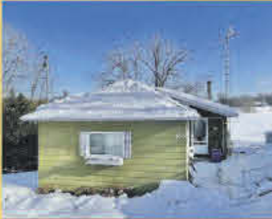
249 000$ Saint-Roch-de-Richelieu

Ancien bar converti en grande et originale maison avec immense potentiel. Beaucoup d'espaces, 6 chambres en plus du sous-sol et de la salle familiale au 2e étage. Vaste chambre à coucher principale. Située sur un coin de rue secteur Tracy près de tous les services à pied et du transport en commun. N'hésitez pas à visiter!