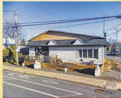
195 000$ Sorel-Tracy

Maison chaleureuse et bien entretenue avec accès au Chenal Tardif d'une part et d'autre de la route. Constituée de 2 chambres, piscine hors terre, balcon avant et arrière et accès au garage. À proximité de garage, épicerie et autres. À 1h30 de Montréal et 45 minutes de Trois-Rivières. Aucun voisin à l'arrière. Adoptez la vie paisible!