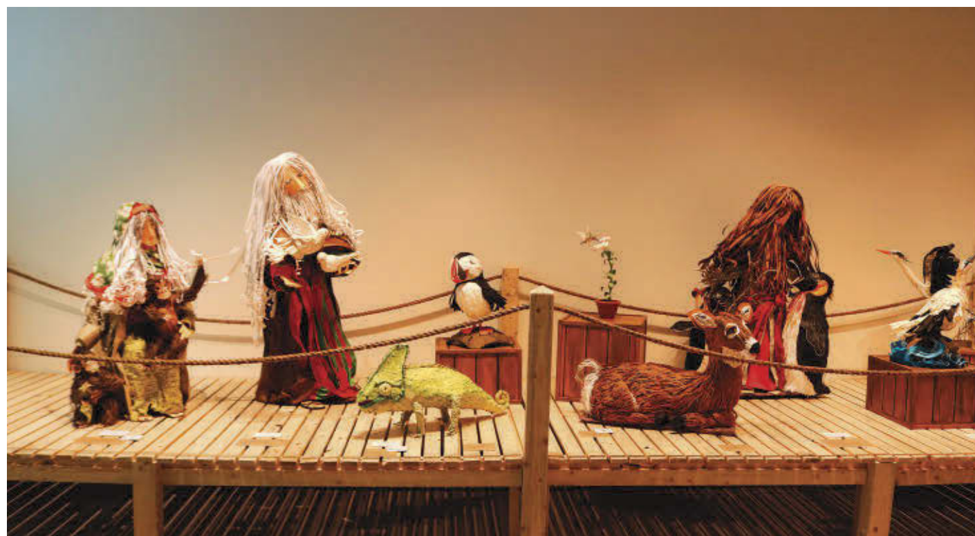
L'exposition met de l'avant les sculptures en papier de l'artiste Claude Lafortune.