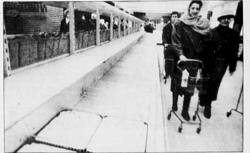
La multiplication par trois, quatre ou cinq des prix de détail n'a pas encore conduit à une amélioration de l'approvisionnement.

Par rapport aux pays est-européens, les Républiques de la CEI souffrent d'abord d'une moindre proximité historique et géographique à l'égard du marché. Soixante-dix ans d'économie centralisée administrée ont modifié les comportements