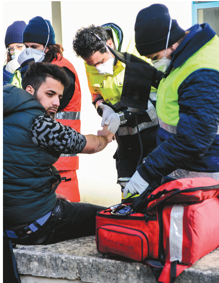
Un « passager » du Blue Sky M se faisait soigner pas une équipe médicale italienne, le 31 décembre dernier, à Gallipoli.