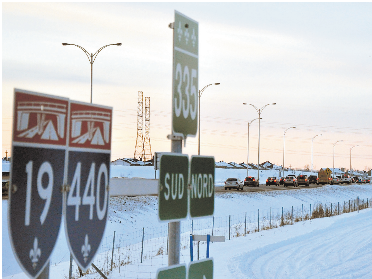
La route 335, qui lie les autoroutes 640 et 440, est le théâtre d'embouteillages continus.