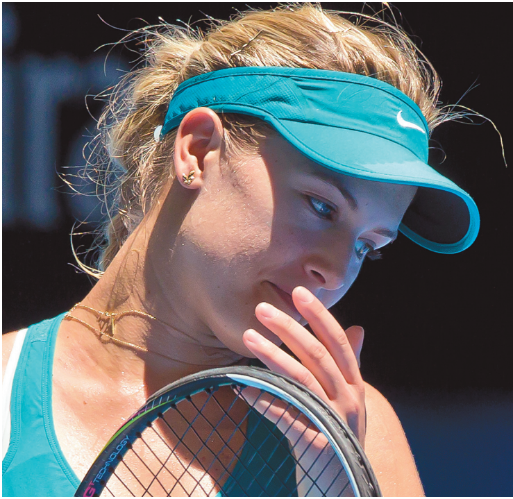
TONY ASHBY AGENCE FRANCE-PRESSE