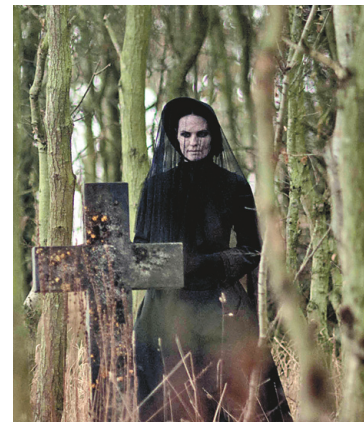
Le fantôme de la dame en noir réclame de la chair enfantine pour compenser la perte ancienne de son fils.