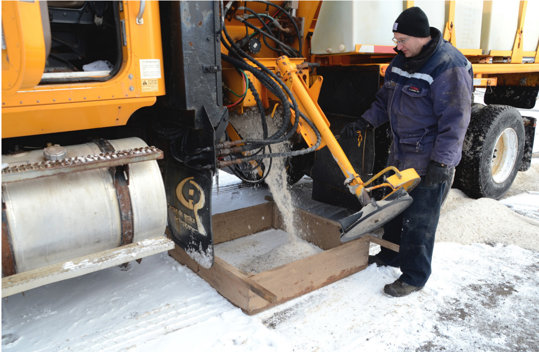
Figure 4 – Essai en cours