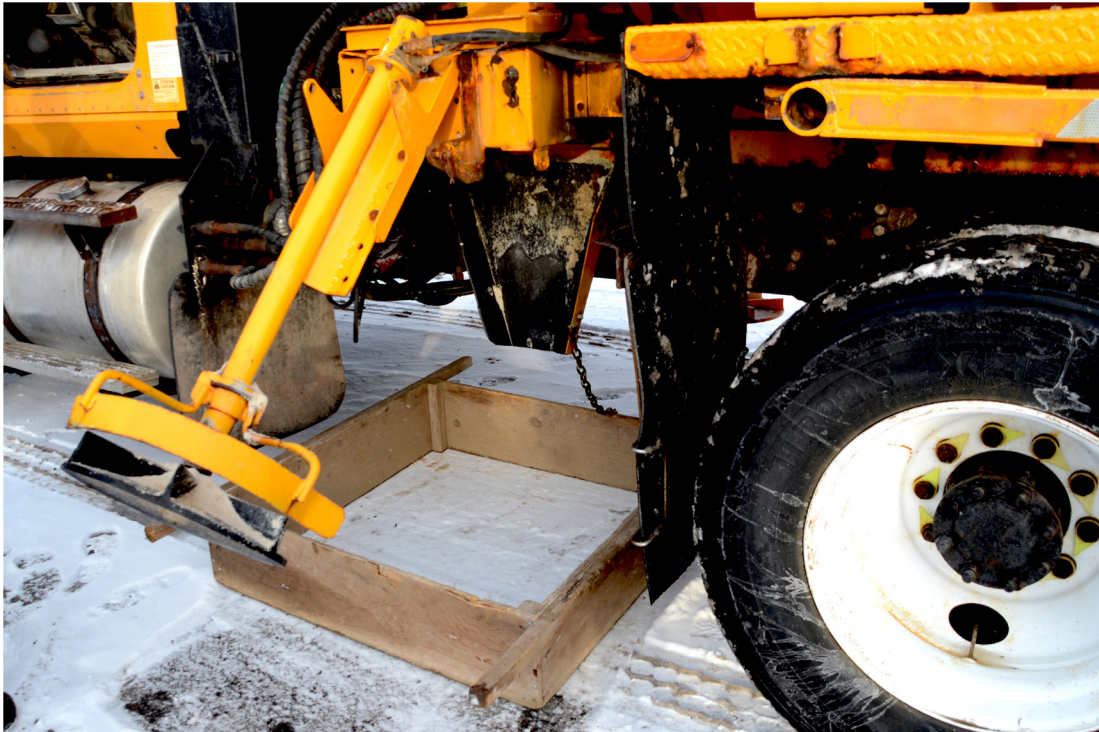
Figure 3 – Montage d'essai

Afin de vérifier que chacune des actions préalables a été entreprise, utiliser la liste de contrôle présentée à l'annexe 2. Il est important de valider chaque point de cette liste de contrôle. La qualité des résultats obtenus sera ainsi assurée.