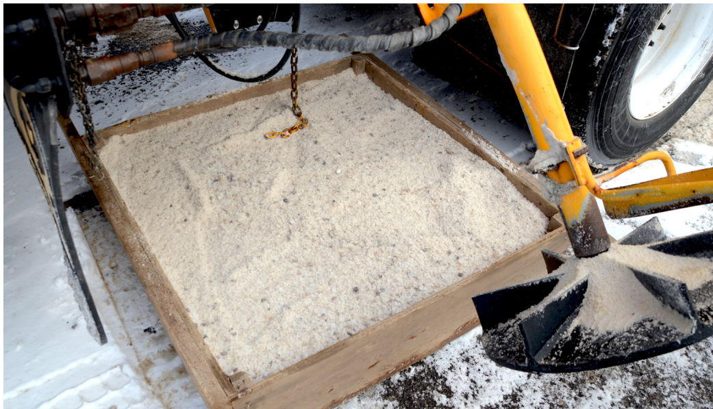
Figure 5 – Matériaux de niveau