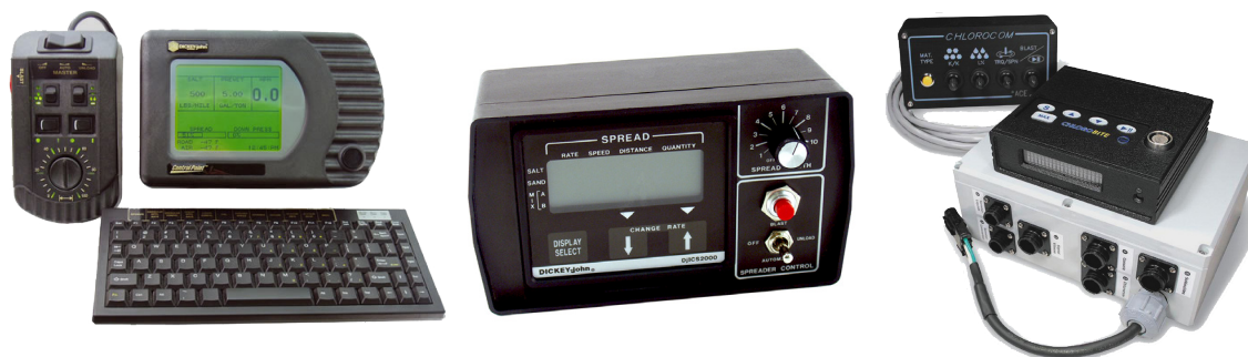
Figure 1 – Types de régulateurs d'épandage électroniques

En plus du régulateur, la hauteur de la porte d'alimentation de l'épandeur influe considérablement sur la précision des résultats. Il est donc important de bien régler la hauteur de la porte à celle déterminée lors du calibrage. Il est par ailleurs avantageux d'installer un dispositif permettant de connaître la hauteur adéquate de la porte d'alimentation lors des opérations d'épandage.