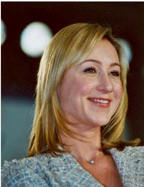
Belinda Stronach -