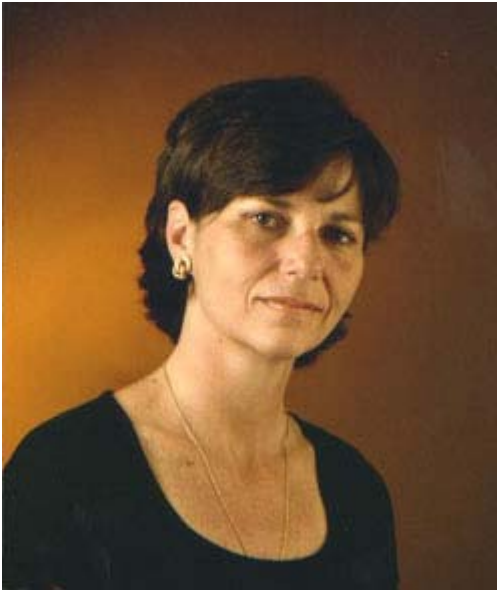
Mary O'Grady - The Wall Street Journal -

Mary O'Grady du Wall Street Journal n'est pas d'accord avec les subventions qu'accordent les gouvernements aux grandes entreprises industrielles. L'éditorialiste senior du prestigieux journal américain était justement à Montréal récemment, suite à l'invitation de l'Institut économique de Montréal. Par hasard, sa visite conférence est tombée la journée même où les gouvernements annonçaient les subventions à Bombardier. Bons joueurs, les représentants de Bombardier étaient présents au déjeuner-causerie. La journaliste O'Grady est catégorique! Les gouvernements doivent compléter l'entreprise privée et non la remplacer. Ce dossier de Bombardier connaît d'ailleurs un drôle de développement car les deux principaux fabricants mondiaux de moteurs refusent de construire pour Bombardier. Même avec les subventions obtenues, s'il n'y a pas de moteur... il n'y a pas d'avions! www.wsj.com