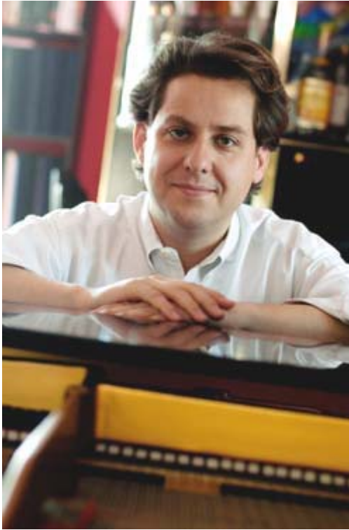
Alain Lefèvre -

Alain Lefèvre voit son étoile briller de pleins feux. En plus d'avoir mis sur le marché un disque récent rendant hommage à André Mathieu, voilà qu'il accumule les honneurs au sein d'événements musicaux d'envergure alors qu'il sera le porte-parole officiel du 28e Festival de Lanaudière. Ce prestigieux festival québécois se déroulera du 9 juillet au 7 août prochain. Lefèvre est un pianiste de grand talent dont la réputation est internationale et qui a compris que l'enregistrement de disques peut être une carte essentielle pour maintenir son public intéressé. Au total le pianiste a enregistré plus de neuf disques depuis 1994. L'artiste a commencé à jouer du piano dès l'âge de 4 ans. www.alainlefevre.com