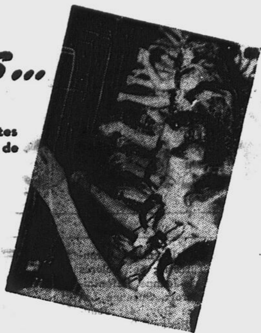
Les téléphonistes de Lac Mégantic branchent 2,800 appels locaux par jour... et pourtant, neuf fois sur dix, elles répondent en moins de dix secondes.

LA COMPAGNIE DE TÉLÉPHONE BELL DU CANADA