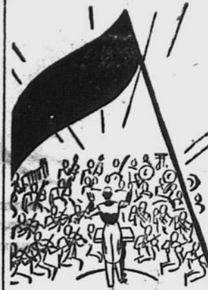
Un hommage au talent de nos hommes et femmes célèbres et un encouragement à ceux qui suivent leurs traces.

Les Dames Tertiaires nous prient de remercier sincèrement, par la voix de "L'Echo de Frontenac" toutes les personnes qui ont contri-