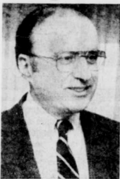
M. Herbert Marx, ministre de la Justice responsable de la Protection du consommateur.

De plus, s'il s'agit d'une vente ou d'une sollicitation effectuée à domicile ou ailleurs qu'à sa place d'affaires, donc d'une vente itinérante, les mêmes dispositions d'annulation