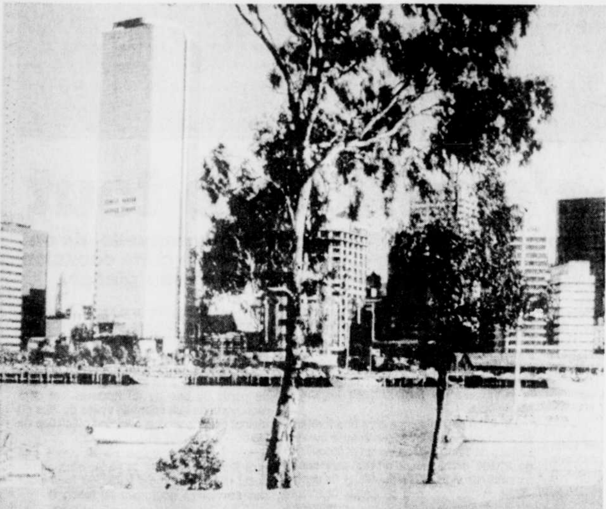
Les ouvriers s'affairent toujours pour permettre l'ouverture de l'exposition de Brisbane dont on voit ici une vue générale.

Un laissez-passer d'une journée pour l'Expo coûtera $25 (US) pour un adulte, et $15 (US) pour un enfant ou une personne du troisième âge. Des laissez-passer de trois jours - qui n'auront pas à être utilisés consécutivement - coûteront respectivement $55 et $35. ●