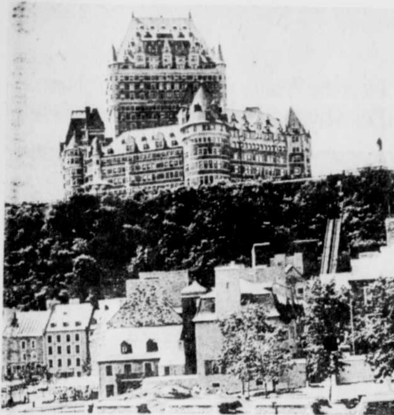
Le Château Frontenac à Québec.

La Corporation des hôtels Canadien Pacifique qui possède, entre autres, le réputé Château Frontenac a lancé officiellement cette semaine sa nouvelle « classe affaires » qui garantit des services supérieurs aux gens d'affaires qui voyagent.