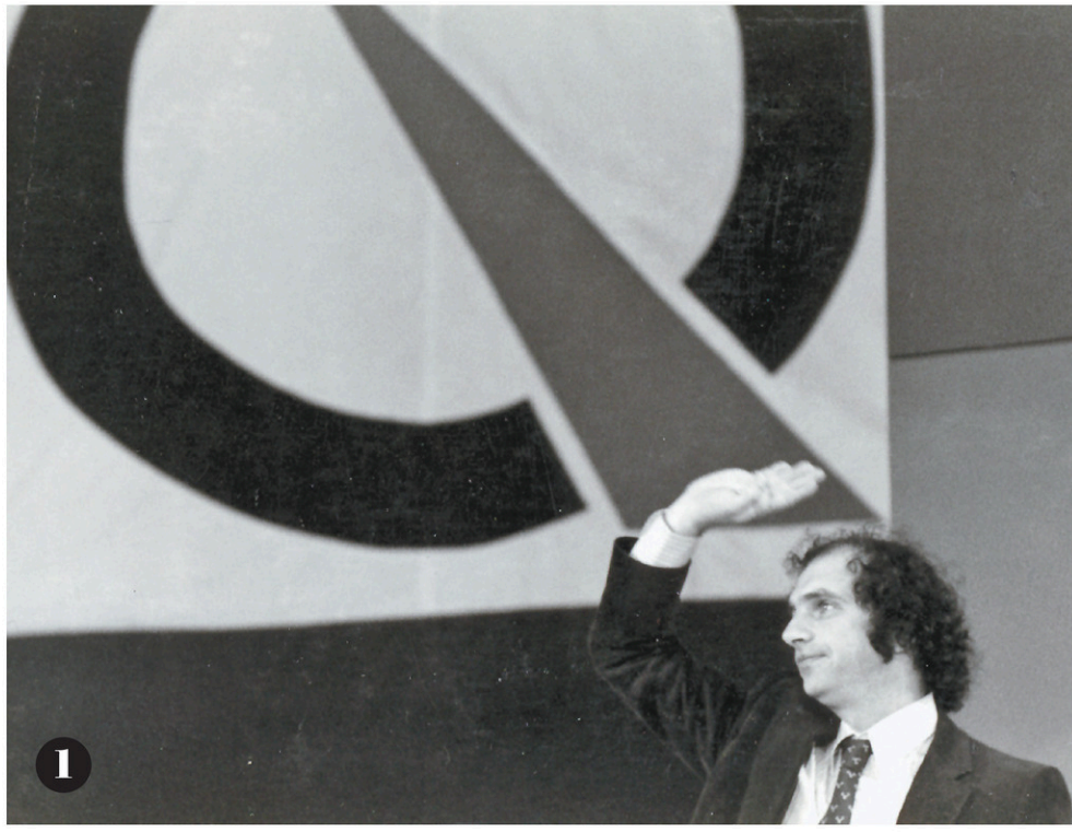
1 L'élection de Claude Charron en novembre 1976