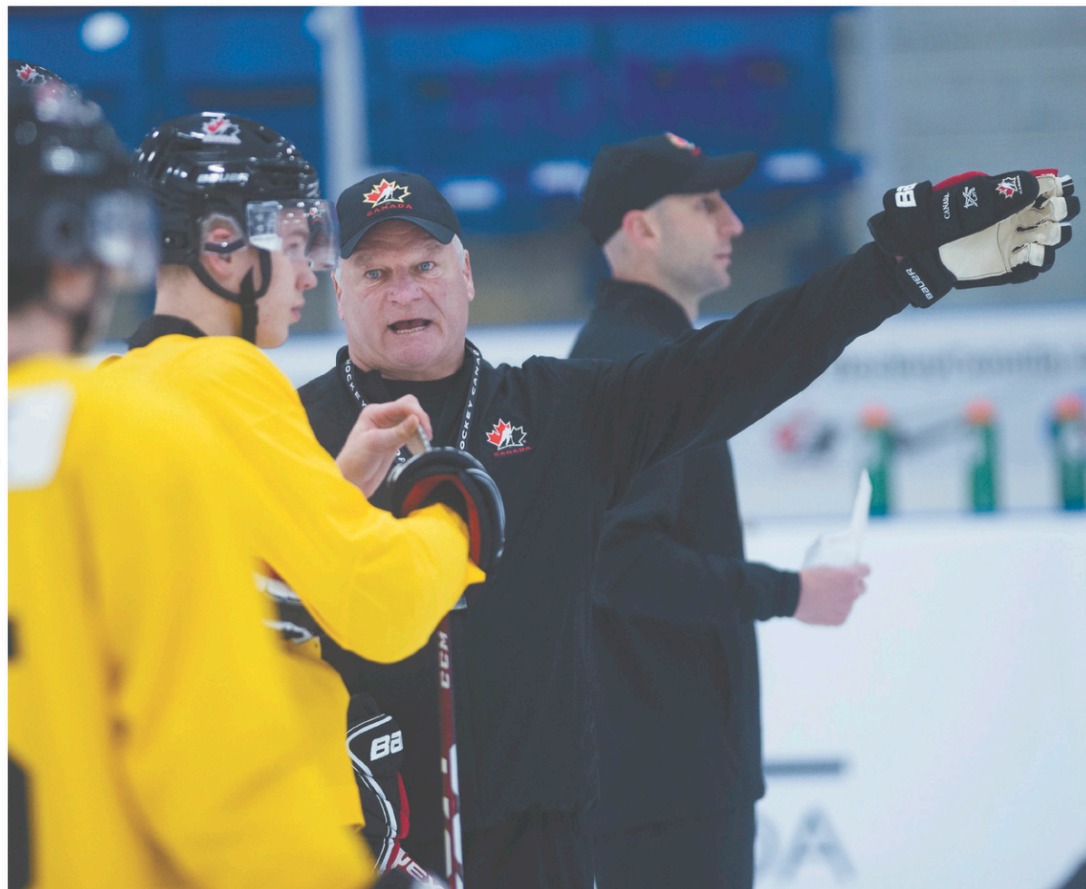
Apprécié des amateurs pour sa combativité quand il portait les couleurs des Nordiques de Québec, Dale Hunter exige un travail sans relâche de ses joueurs.