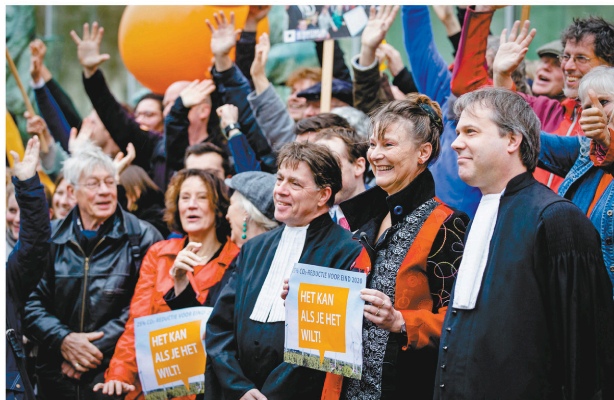
L'organisation écologiste Urgenda a lancé, avec 900 citoyens, cette action en justice il y a déjà quatre ans.