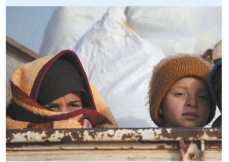
Des milliers de familles ont fui Idleb cette semaine.

NATIONS UNIES — La Russie et la Chine ont mis vendredi leur veto au Conseil de sécurité à un projet de résolution de l'Allemagne, de la Belgique et du Koweït étendant d'un an l'aide humanitaire transfrontalière de l'ONU à quatre millions de Syriens, que Moscou veut réduire radicalement. Les autorités syriennes « ont repris le contrôle sur la majeure partie du territoire » et cette résolution est « obsolète », a dit l'ambassadeur russe à l'ONU, Vassily Nebenzia. « Il n'y a pas d'alternative », a rétorqué l'ambassadrice adjointe de la France, Anne Gueguen. L'autorisation onusienne sur l'aide transfrontalière expire le 10 janvier. Des dizaines de milliers de civils ont fui les bombardements du régime syrien et de son allié russe cette semaine à Idleb, dernier grand bastion hostile à Damas, où les combats se sont intensifiés vendredi, ont indiqué les Nations unies. Agence France-Presse