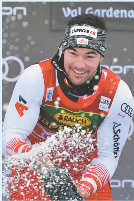
Vincent Kriechmayr