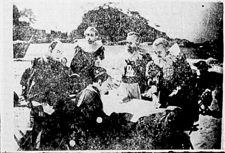
L'arrivée des espagnols.

PAYSAGES JAPONAIS SPLENDEURS DE LA COUR IMPERIALE