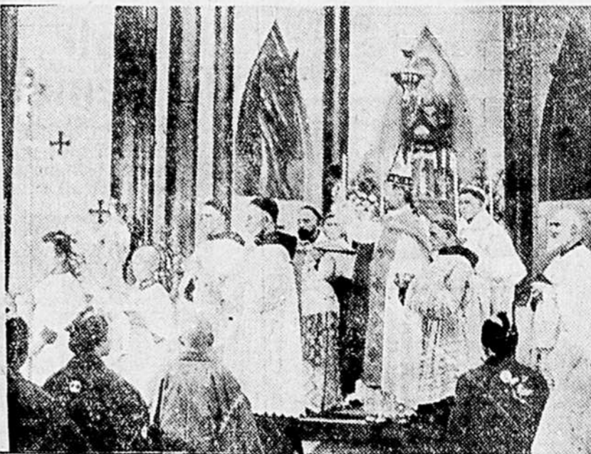
Bénédictio de l'église de Kyoto.