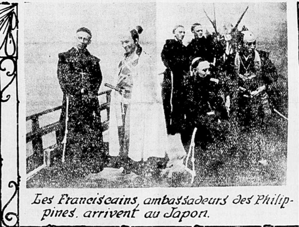
Les Franciscains, ambassadeurs des Philippines, arrivent au Japon.