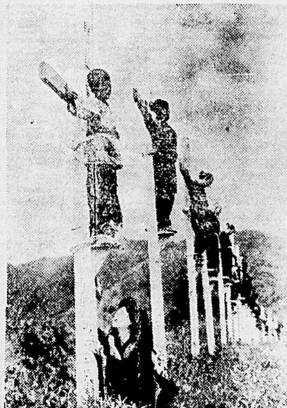
Une mère près de son enfant martyr à 11 ans.

A LA SALLE ACADEMIQUE DU SEMINAIRE, JEUDI, LE 19 AVRIL, A 8 HEURES.