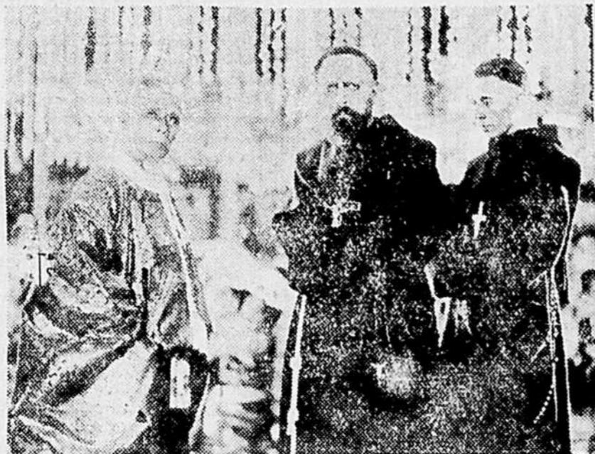
Reçus par le Shogun