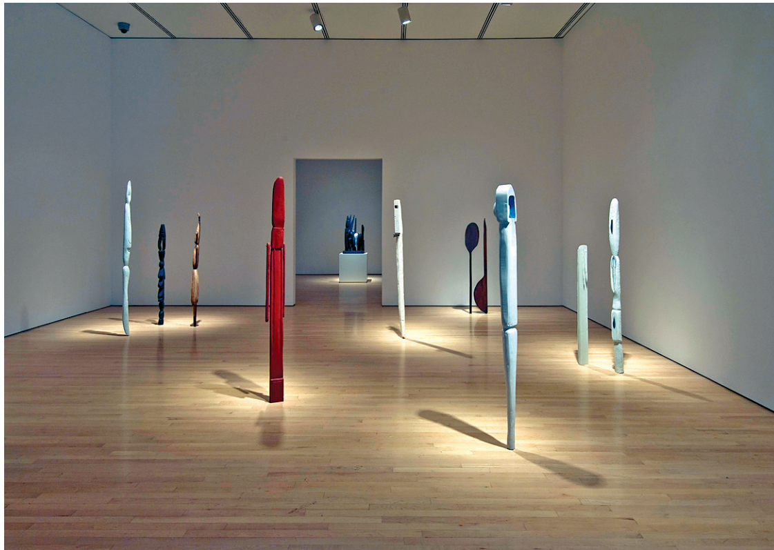
Vue des œuvres de la série des Personnages et Forêt (Night Garden) , de Louise Bourgeois (1911-2010), au Musée des beaux-arts du Canada.

Conçues et présentées à la manière d'une installation environnementale, les sculptures sont disposées par petits groupes et rappellent des individus qui discuteraient lors d'un cocktail ou d'une soirée; surgissant du sol, sans base ou socle, elles semblent posées en équilibre précaire, ce sentiment d'insécurité reflétant sans aucun doute celui qui habitait Louise Bourgeois au moment de son installation aux États-Unis.