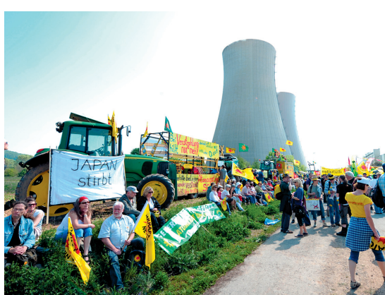
Près de 150 000 personnes ont manifesté hier en France et en Allemagne.

Aux abords des sites nucléaires, les manifestants ont notamment planté des croix de bois pour rendre hommage aux victimes japonaises. «La participation importante à ces manifestations montre que la population ne fait pas confiance au gouvernement en matière de politique nucléaire», a estimé Jochen Stay, porte-parole de Ausgestrahlt. La revendication répétée plus de 100 000 fois aujourd'hui est la suivante: toutes les centrales nucléaires doivent être mises à l'arrêt.»