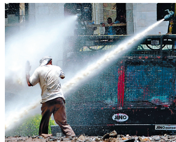
Un manifestant à Taiz, hier