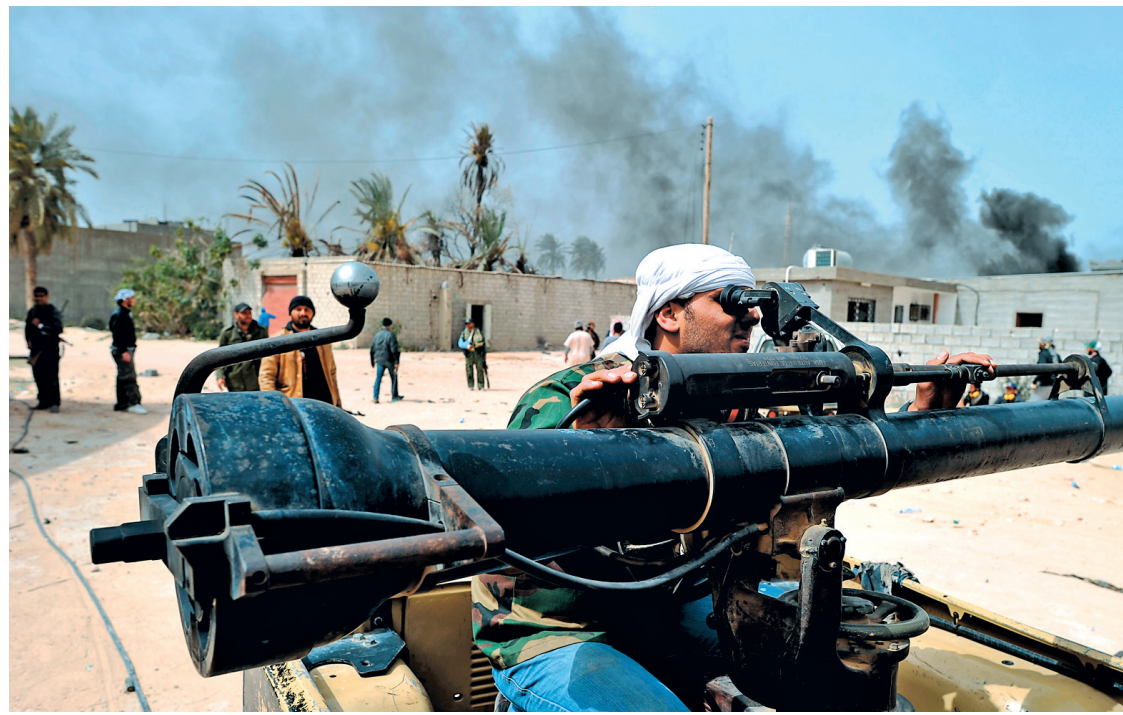
Les combats et bombardements ont fait au moins 55 morts et plus de 200 blessés samedi et dimanche à Misrata.