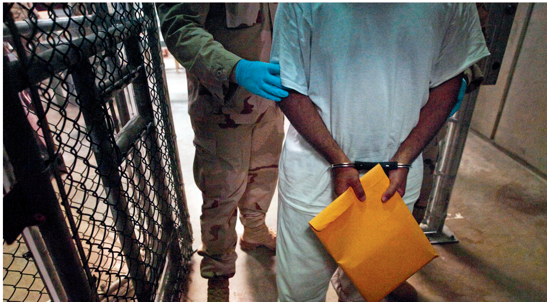
Les États-Unis ont gardé à Guantánamo des centaines de détenus innocents ou sans grand danger, mais libéré des dizaines de prisonniers «à haut risque», selon des documents révélés par WikiLeaks.