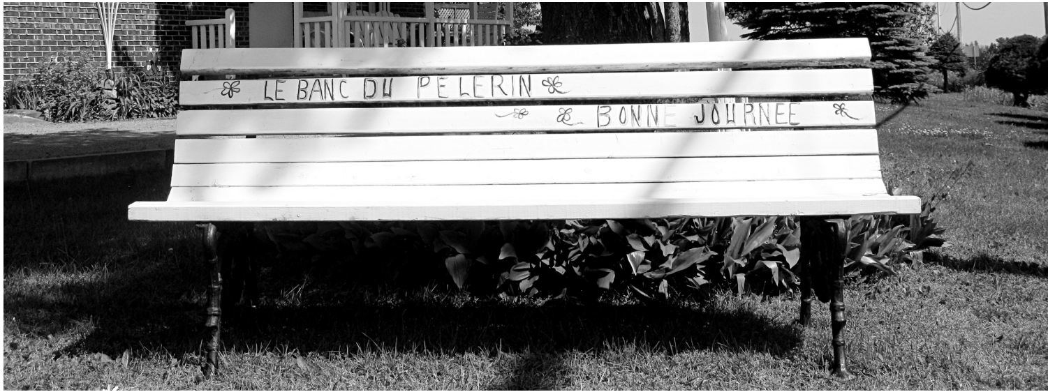
Banc des pèlerins devant la croix du chemin de Grand-Capsa sur le chemin des Sanctuaires à Pont-Rouge.

Les chemins pédestres qui relient les églises d'un bout à l'autre de la province offrent une occasion de partager un moment de foi et de culture avec une communauté.