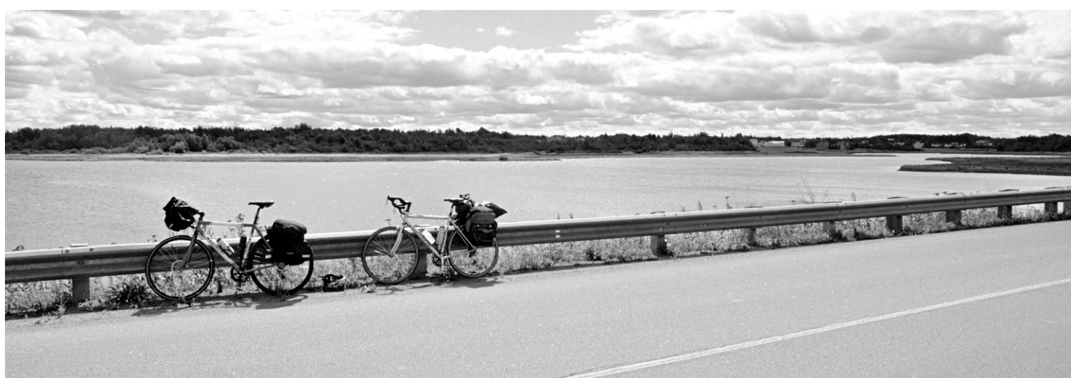
La route sur la côte du Nouveau-Brunswick permet de découvrir plusieurs paysages.