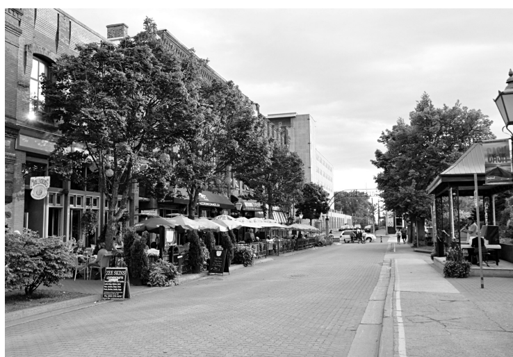
Le quartier historique de Charlottetown est rempli de magnifiques demeures et de petits commerces sympathiques.

mûriers, qui encadrent le sentier. (Pour l'anecdote, l'office de tourisme nous informe que l'Île-du-Prince-Édouard a été la première province en 2000 à relier les 274 kilomètres de sa portion du Sentier transcanadien, sentier récréatif le plus long du monde qui reliera tout le territoire canadien.)