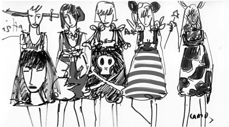
MAISON JEAN-CHARLES DE CASTELBAJAC

Le créateur et artiste multidisciplinaire français Jean-Charles de Castelbajac est le président et invité d'honneur du Festival Mode & Design cette année. Ci-dessous, l'un de ses croquis.