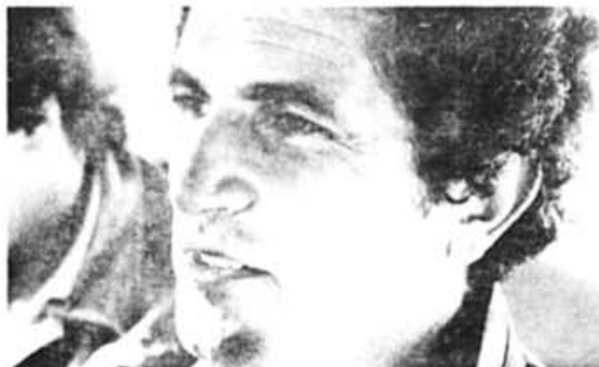
Dans le cadre de Filmer pour vivre , à 20h, sur les ondes de Radio-Québec, portrait du cinéaste français CLAUDE LELOUCH.