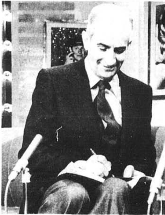
Le (99) rend hommage à LOUIS DE FUNES lors d'une émission spéciale intitulée Monsieur de Funès . Ce soir à 22 h 10.

AN AMERICAN FAMILY avec Ted Danson, Shelley Long et