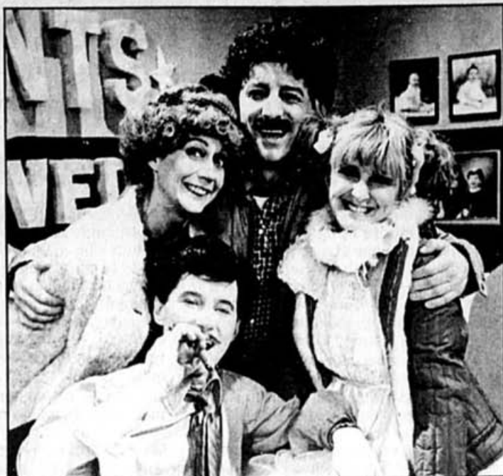
Marc Messier, Pauline Martin, Michel Côté et Dominique Michel dans Bye Bye 85 .