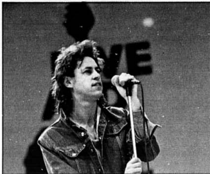
Bob Geldof, le grand gourou de 1985.

E n 1985, un petit Irlandais de 30 ans a déplacé des montagnes. C'est Bob Geldof. Jeune, éveillé, rockeur crypto-punk... il est le plus sérieux candidat au prochain Nobel de la Paix !