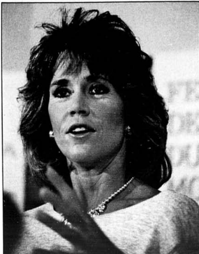
Jane Fonda est la vedette du Syndrome chinois , présenté cette semaine par les stations du réseau TVA. Châtaïne lors de son passage au Festival des films du monde (notre photo), on la retrouvera en rousse dans le film.

King Kong (16 h 00) — Un classique du cinéma fantastique. Tourné en 1933. Évidemment, les truquages à cette époque, pas du Spielberg! Mais la magie du cinéma opère. Et le film, encore