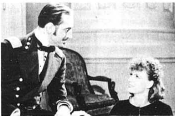
À 21 h, le 33 présente GRETA GARBO et BASIL RATHBONE dans le film Anna Karenina réalisé en 1935, d'après le roman de Tolstoï.