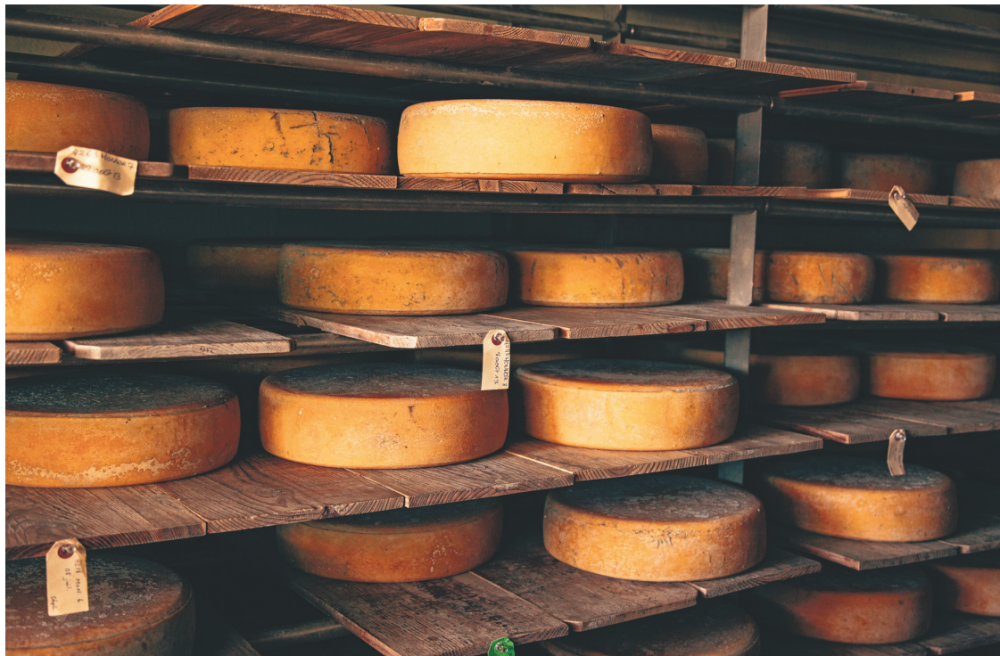
À la fromagerie Au gré des champs, les vaches en liberté donnent des fromages biologiques au lait cru uniques au Québec.

Gaspor - Fermes St-Canut, près de Saint-Jérôme, est un exemple d'intégration rurale et de respect pour l'élevage de ses porcelets, en plein bois, qui jouent au ballon et sont traités