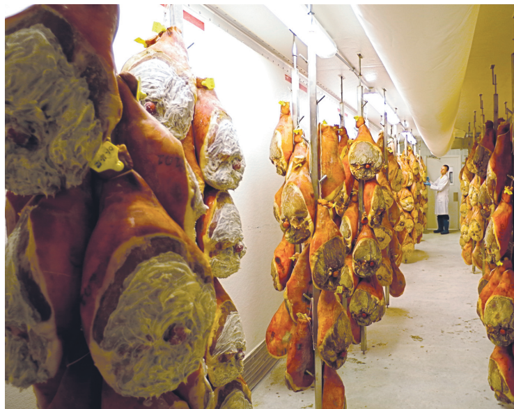
Depuis quelques années, Les viandes biologiques de Charlevoix préparent le meilleur des pâtés, du saucisson et un jambon blanc.

Charlevoix, comme c'est beau, et de plus, on y mange bien. Les artisans alimentaires