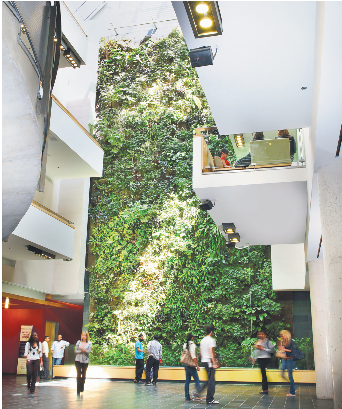
NEDLAW LIVING WALLS

Et c'est moins cher que le dig and dump — une pratique courante pour déplacer un sol contaminé... qui ne fait que déplacer le problème. Toutefois, il faut compter entre 5 et 50 ans pour nettoyer un sol,