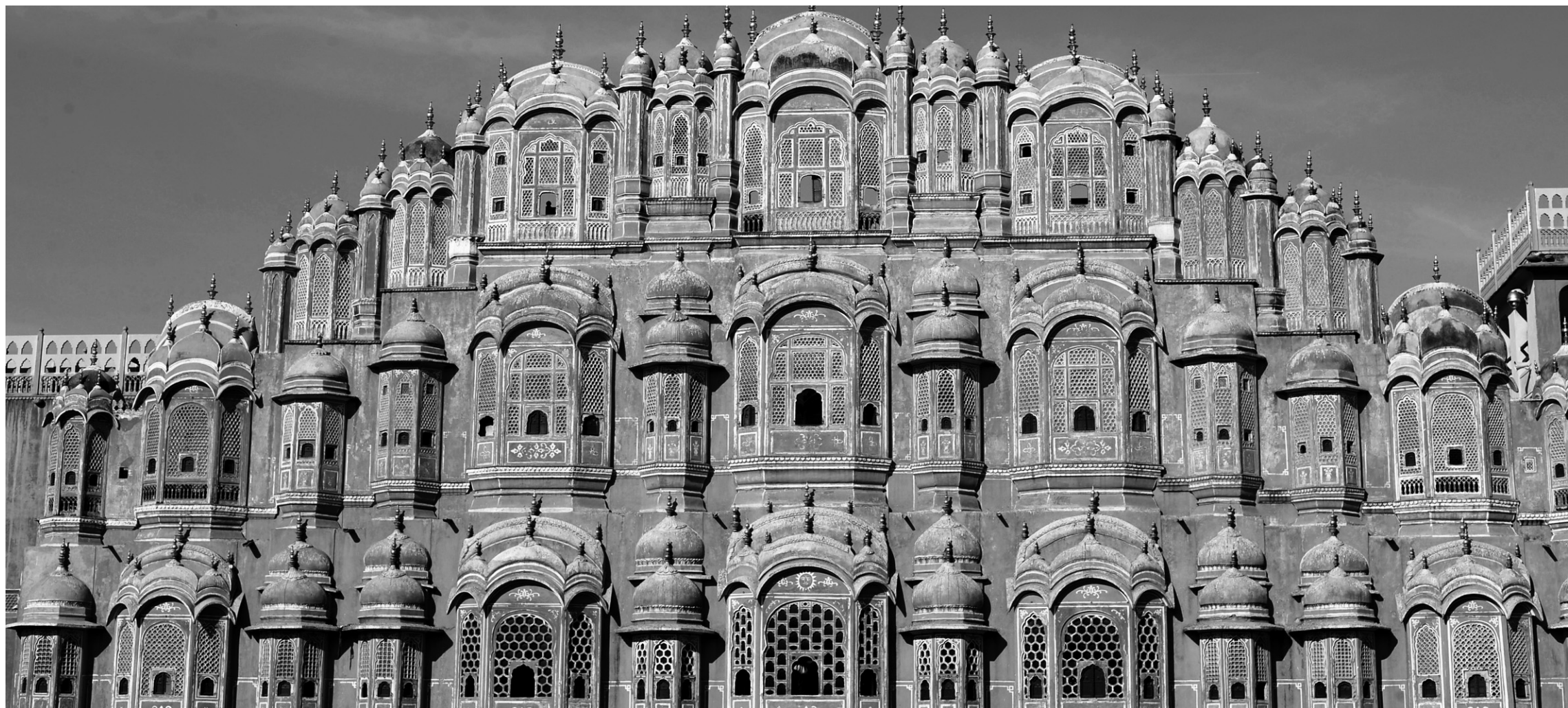
La façade du Hawa Mahal, ou « Palais des vents », dans la vieille ville de Jaipur, en Inde

Quoi qu'on en dise, la Corse est un pays à elle seule. Tout se visite. La voiture est indispensable car les routes sont étroites, mais elles réservent tant de surprises. Bastia et Ajaccio sont les deux villes principales, mais Calvi, Bonifacio, Porto Vecchio et tout l'intérieur révèlent de beaux secrets.