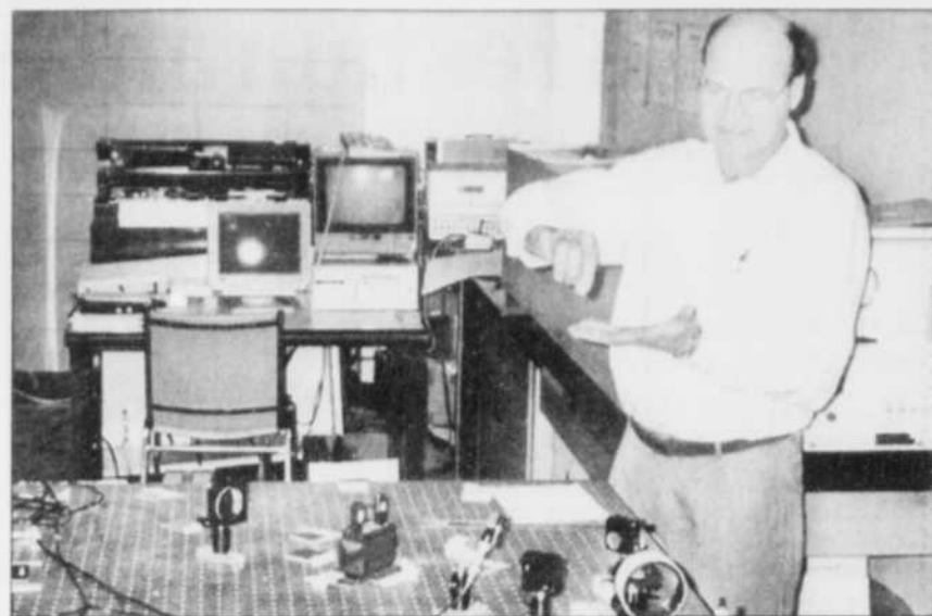
Un professeur du cégep explique le fonctionnement des équipements du département de Technologies physiques.