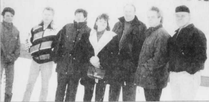
Les pêcheurs se sont réunis hier, près de l'usine.