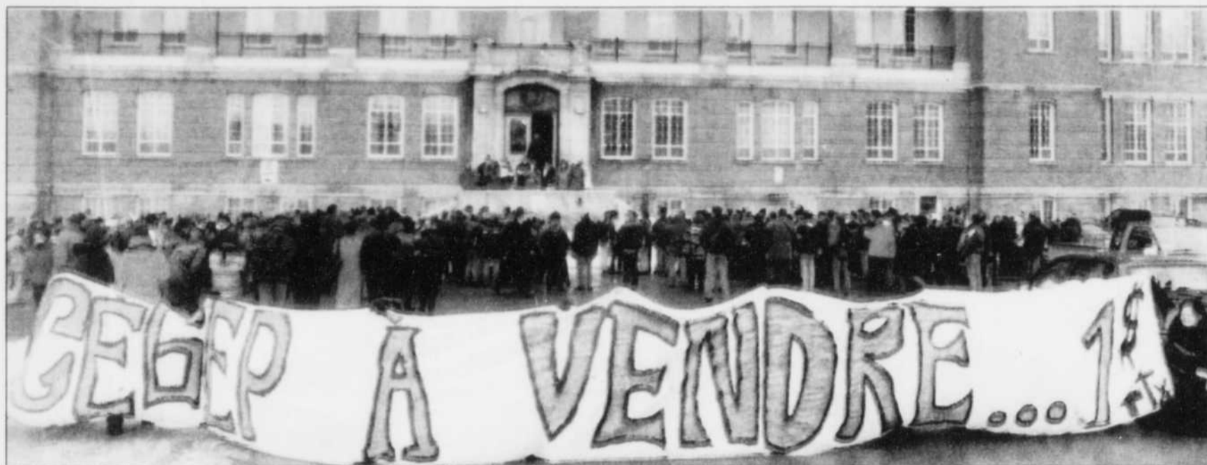
Le groupe a déployé une longue banderole « Cégep à vendre... 1 $ » pendant la manifestation à Rimouski, hier.

1 000 milles Aéroparc GOUVERNEUR HÔTEL PLACE DUPUIS MONTRÉAL «Mon hôtel à Montréal» À chaque séjour, doublez vos milles Aéroparc durant les mois de janvier, février et mars 1998. 1 888 910-1111