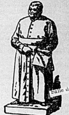
Salle de l'oct de l'A. L.

LE MOT DE L'AVENIR EST DANS LE PEUPLE MÊME NOUS VEARRONS PROSPÉRER LES FILS DU ST LAURENT (B. SULTZ.)