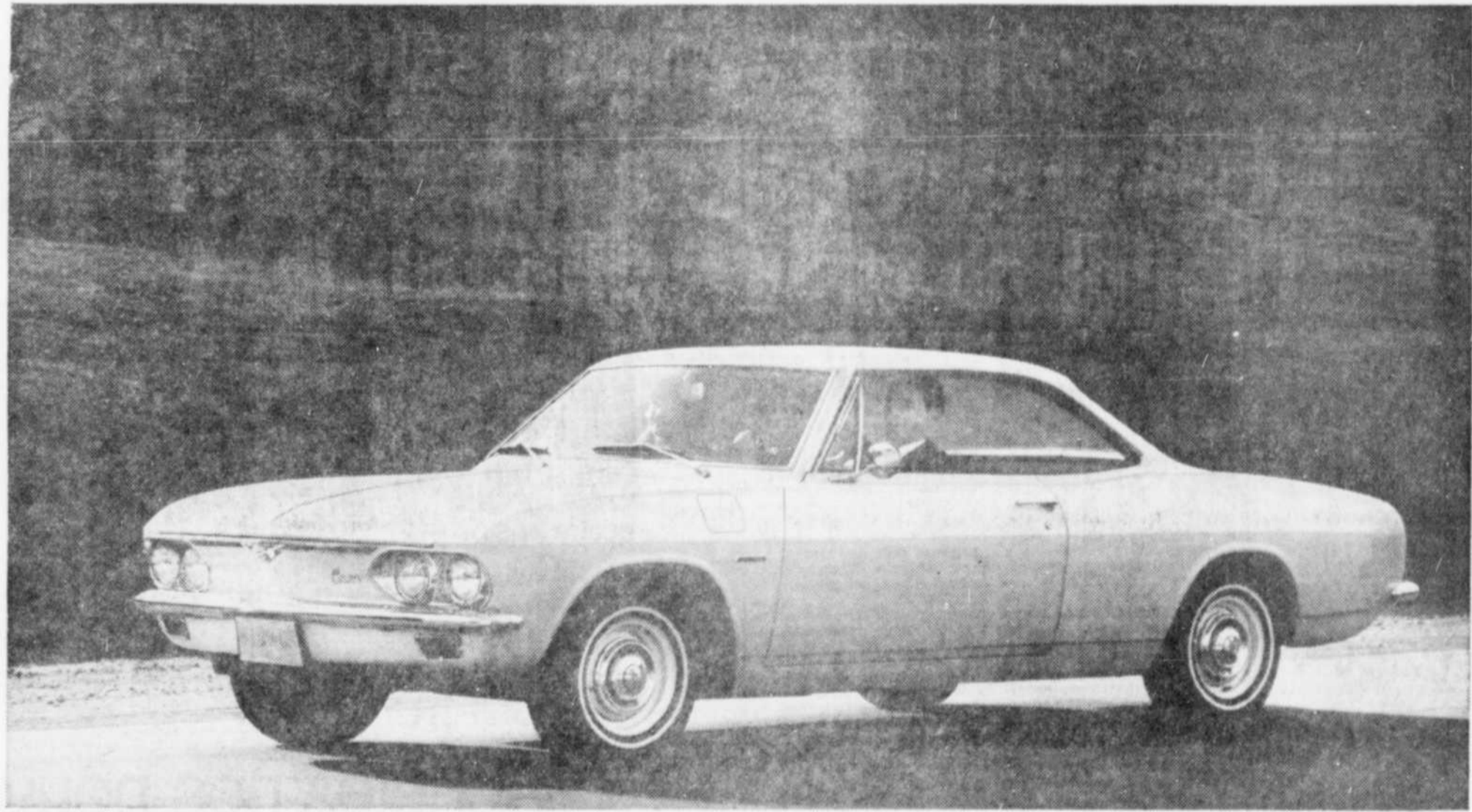
Le coupé sport Corvaire 500. Croyez-le ou non, c'est le meilleur marché des hardtops au Canada. Huit dispositifs de sécurité en équipement standard, dans le rétroviseur extérieur. Jetez-y toujours un coup d'œil avant de dépasser.

Voici les faits: • La Corvaire est le meilleur marché des hardtops au Canada • Il y a 1,500,000 propriétaires de Corvaire Maintenant, à vous de juger!