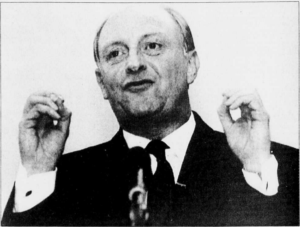
Le leader du Parti travailliste, M. Neil Kinnock, s'est adressé hier aux délégués de la conférence générale de son parti qui se tient à Brighton.

Le dirigeant de l'opposition travailliste, M. Shimon Pérès, a de son côté déclaré à la radio qu'il ne pensait pas qu'il y aurait des élections anticipées. « Il ne s'agit que d'une opération de manipulation des médias de M. Shamir pour satisfaire les partis d'extrême-droite », a-t-il dit.