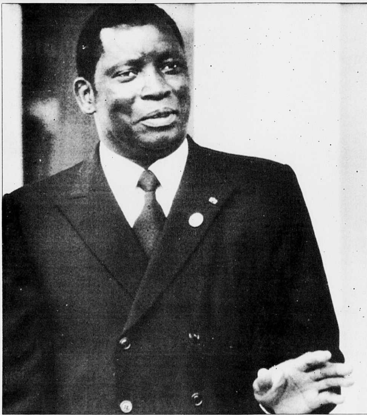
Le président togolais, Gnassingbé Eyadéma.

« Tous les fonctionnaires du centre ont été inculpés », selon le communiqué.