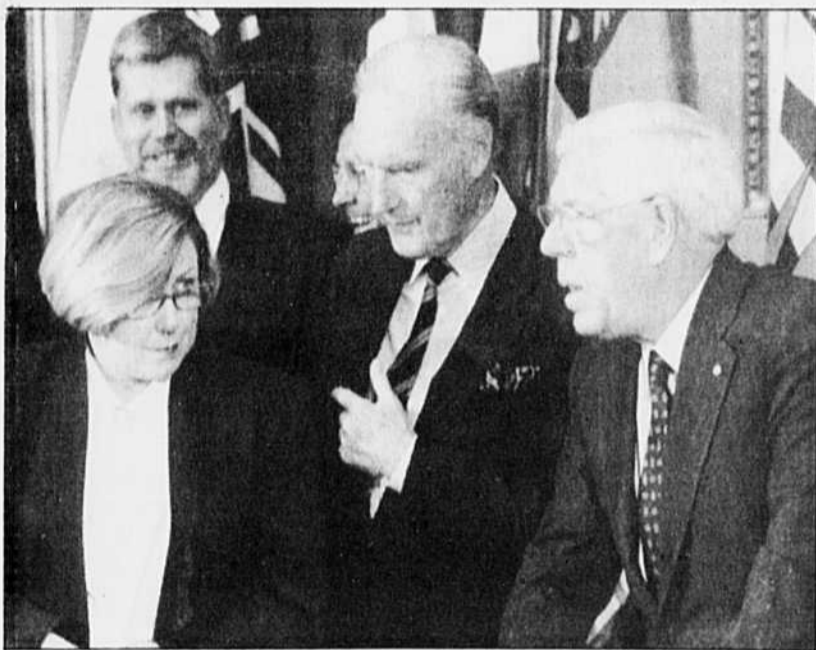
Les coprésidents du comité mixte du Sénat et des Communes, Mme Dorothy Dobbie et M. Claude Castonguay, ont eu leur première réunion, hier, en présence du leader libéral du Sénat, Royce Frith.