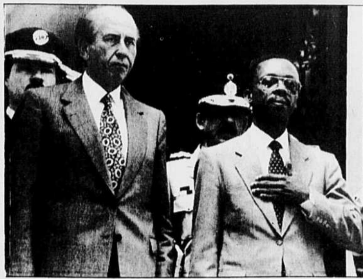
Le président haïtien Jean-Bertrand Aristide en compagnie de son homologue vénézuélien Carlos Andrés Pérez à Caracas hier.