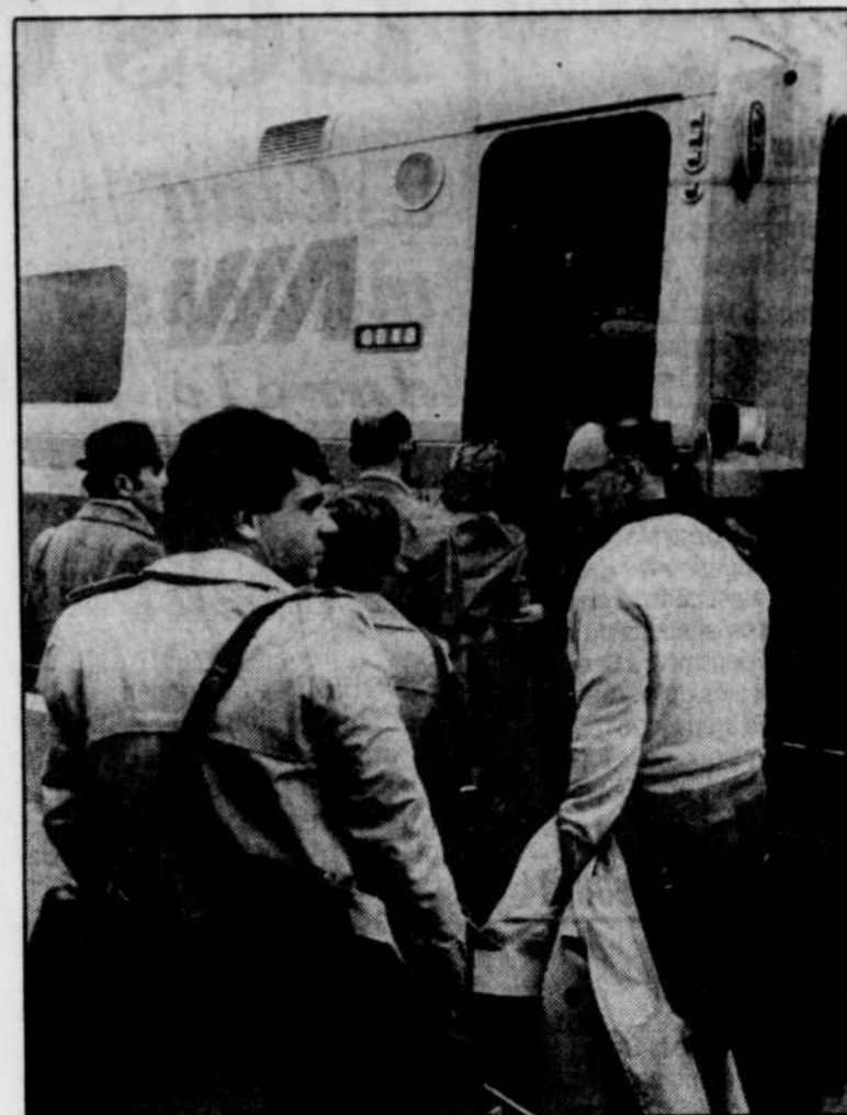
En 1992, 39 000 personnes ont pris le Chaleur entre Montréal et Gaspé, pour un taux d'occupation de 69 %.

« Ce que nous avons noté, ce n'est pas de la mauvaise gestion, mais de la mauvaise volonté », résume Dominique Léger, agente de la gare de New Carlisle. « Malgré tous les bâ-