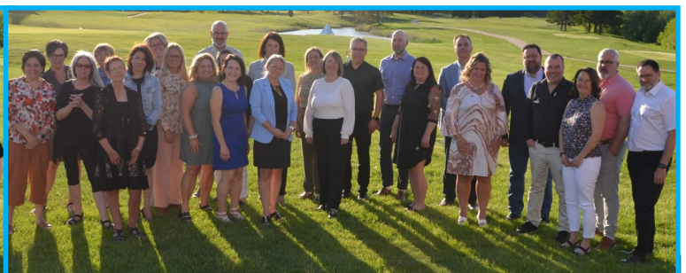
Les employés cumulant 25 années de service ont également reçu un coffret prestige. Cette soirée de reconnaissance était la première activité organisée par le nouveau comité de reconnaissance du CSSPB.