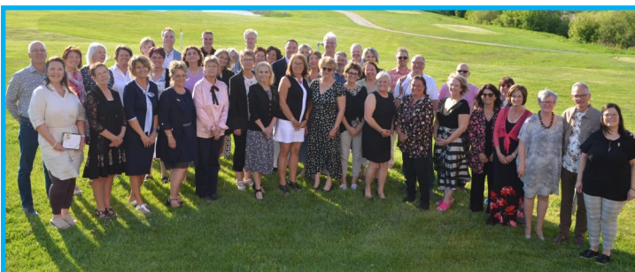
Le groupe des retraités qui a participé à la soirée reconnaissance du 30 mai dernier. Chacun d'eux a reçu un coffret prestige lui permettant de sélectionner des activités parmi un vaste choix.