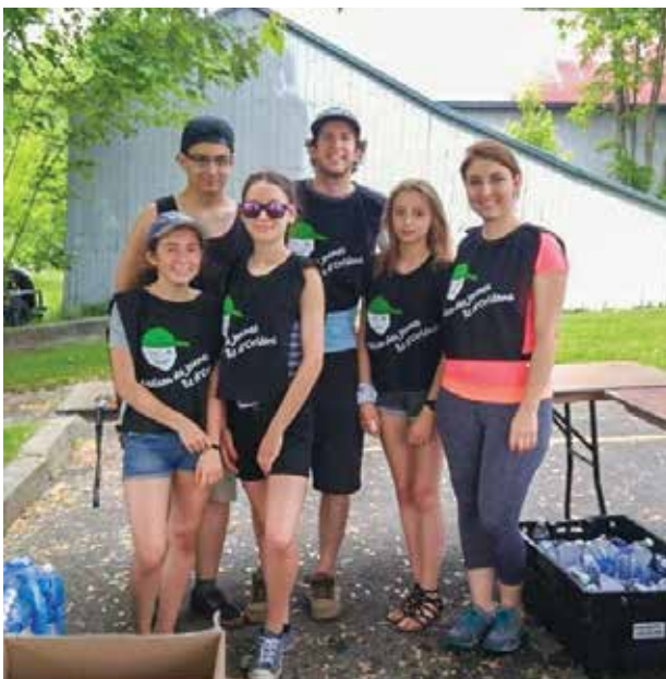
Tour de l'Île à Vélo, 19 juin 2016! Merci et félicitations à tous les jeunes bénévoles qui ont contribué aux ravitaillements des cyclistes et à la gestion du stationnement!

D'abord, il est impératif de bien savoir reconnaître ce type de breuvage. La plupart des adolescents connaissent très bien les grandes marques de boissons énergisantes comme Red Bull ou Monster en raison des campagnes de publicité orchestrées par les grandes compagnies. Les boissons énergisantes sont souvent composées d'ingrédients comme la caféine, le sucre et la taurine qui visent à procurer à la personne qui en consomme beaucoup d'énergie sur une courte période. En regardant la liste des ingrédients de certaines de ces boissons, on peut comprendre qu'elles peuvent être dangereuses pour la santé. En effet, une boisson énergisante peut contenir de 50 à 350 mg de caféine, soit jusqu'à l'équivalent de quatre tasses de café! Aussi, chaque cannette de ces boissons peut contenir jusqu'à 14 cuillerées à thé de sucre, selon la marque et le format. Ces produits peuvent aussi contenir de la taurine. Cette substance est souvent méconnue du public ; pourtant, elle peut avoir de