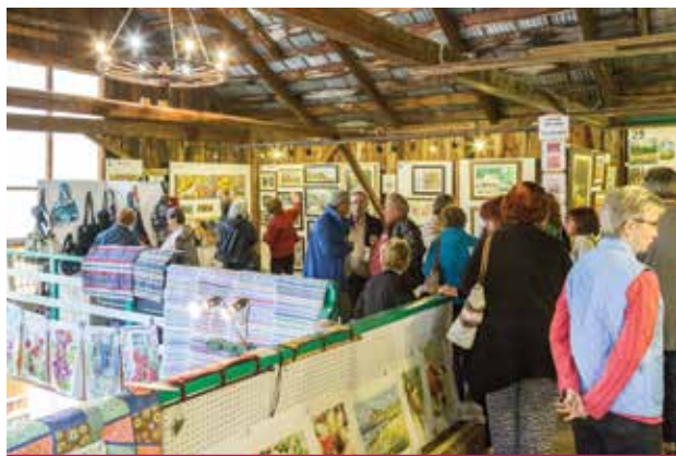
Le Centre d'Art inaugure sa saison estivale le 12 juin dernier.