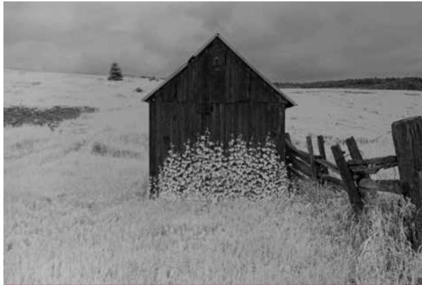
Son habit du dimanche , photographie en noir et blanc (filtre IR simulé), 12 X 18 po. © Arthur J. Plumpton

Cette relation, notre concitoyen Plumpton l'exploite à fond. Par les liens qu'il établit entre les paysages ou les bâtiments qui tiennent lieu de sym-