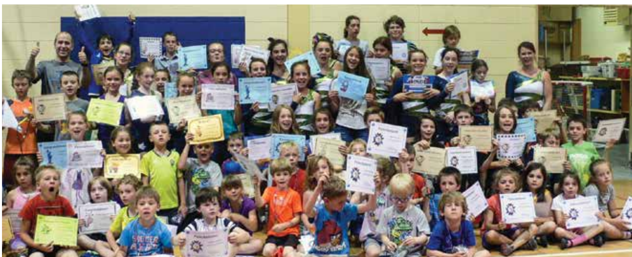
Des élèves de l'École de l'Île-d'Orléans à Saint-Pierre.

terminée avec une démonstration de cheerleading et déjà on sentait un petit air de vacances dans les murs de l'école.