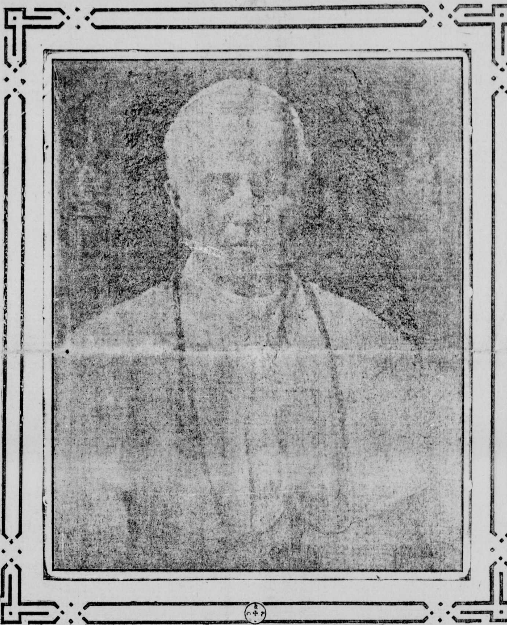
(D'après un tableau de Chs Huot.)

Rien ne saurait mieux nous prouver avec quelle prudence et avec quelle sollicitude vous gouvernez votre Archidiocèse que l'idée salutaire et opportune, que vous ont inspirée les dangers divers et très graves auxquels est exposée votre famille spirituelle, d'établir chez vous l'Action Sociale Catholique, et, conformément aux recommandations des Souverains Pontifes, d'unir par ce moyen tous les vrais catholiques dans un commun désir de lutter pour la religion à l'aide des légitimes