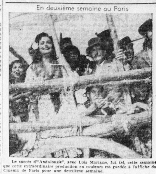
Le succès d'"Andalousie", avec Luis Mariano, fut tel, cette semaine que cette extraordinaire production en couleurs est gardée à l'affiche du Cinéma de Paris pour une deuxième semaine.