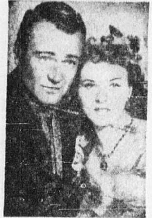
John Wayne et Paulette Goddard dans "Les naufrages des mers du sud", à l'affiche jusqu'à mardi soir avec Abbott et Costello dans "A Hollywood". Et comme attraction supplémentaire "Voyage Royal" en français, en couleurs.