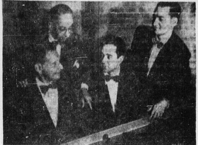
Québec est la seule ville au Canada, (avec Montréal), à recevoir la visite de ce célèbre ensemble. Ce sera un regret artistique unique en son genre. C'est une réalisation des "Soirées Classiques."