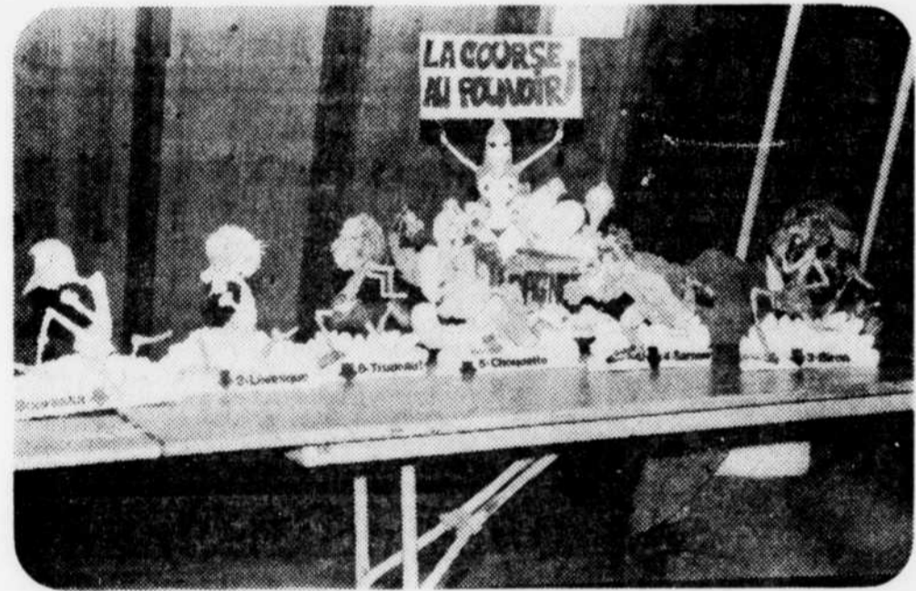
L'écurie des journalistes a bien changé. Chaque année, à la dégustation, des mini-courses sont organisées, ce qui semble jouir d'une popularité toujours croissante. Cette année, les poullins étaient les chefs de partis. Ces caricatures ont été réalisées par M. Pierre Turgeon, caricaturiste à l'Union. Certains coureurs ont surpris.