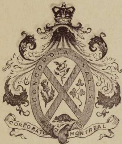
Gravure sur bois, d'une grande finesse, utilisée vers 1854.