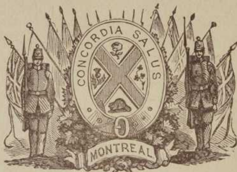
Autre gravure sur bois, peu commune, utilisée pendant l'époque militaire de 1867-1872.

qu'il appartient à la jeune démocratie américaine de réaliser cette merveille de politique: l'apaisement des antipathies de race. Cette légende, il la veut neutre en elle-même, — ni française ni anglaise, — au risque de la rendre grammaticalement incorrecte. Ce n'est pas "Corporation de Montréal" ni "Corporation of Montreal", mais plutôt ces deux seuls mots qui ne trouvent de lien que dans des esprits très conciliants: "CORPORATION — MONTREAL".