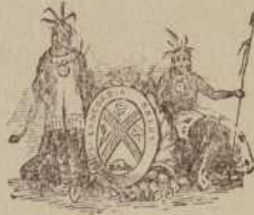
Armoiries de la banque de Montréal, gravées par J. Walker, vers 1865.

au respect des traditions, puisqu'en 1892 l'héraldiste Raymond Beullac était invité à rendre à ces armoiries leur simplicité première. Il émonda, sans oser apporter de corrections essentielles au dessin.