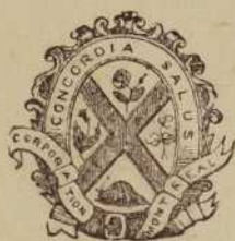
Gravure de 1873 ressuscitant un plus joli dessin de 1845. Restée en usage jusque vers 1895.