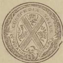
Gravure de 1880