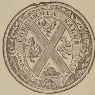
Fac-similé du sceau: Corporation "of" Montréal