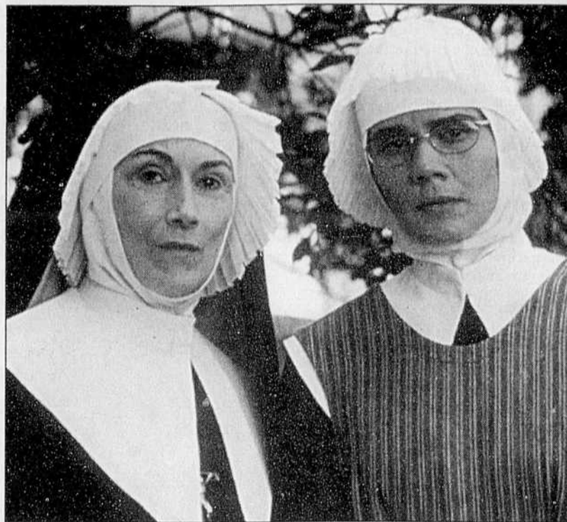
Monique Miller et Marina Orsini, dans Miséricorde .