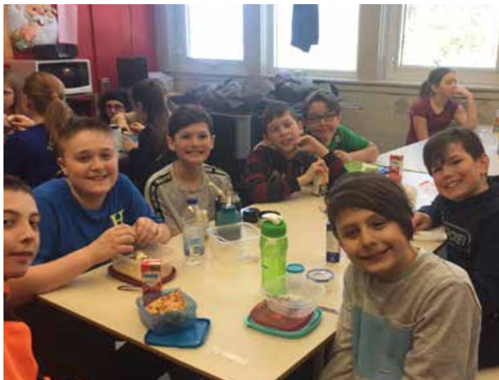
Élèves de l'École Louis de France lors de l'inauguration de la cuisine agro-alimentaire se préparant à manger