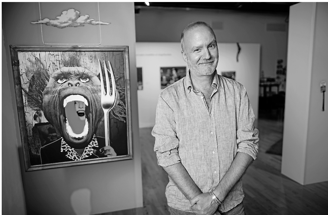
L'illustrateur Pierre-Paul Pariseau expose des œuvres surréalistes et colorées à la maison de la culture de Villeray-Saint-Michel-Parc-Extension.

Depuis quelques années, des revues d'illustration d'Allemagne, du Royaume-Uni, de Taïwan ou de France consacrent des articles à cet artiste