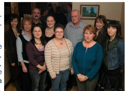
Voici quelques-uns des artistes présents lors du vernissage