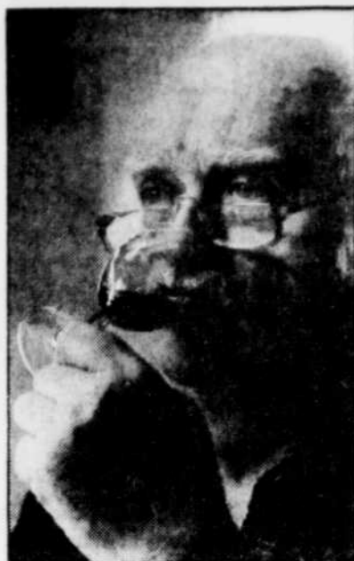
Bien difficile de se prononcer sur le meilleur vin goûté en une journée, lorsqu'il y en a 57 au menu!

La troisième partie de la dégustation eut lieu au début de l'après-midi. J'ai indiqué qu'elle ne devrait pas avoir lieu. La fatigue, le repas assez lourd et autres contingences font que les dégustateurs ne sont pas aussi alertes qu'en matinée. D'ailleurs 57 vins, c'est beaucoup...! Ce fut le moment des