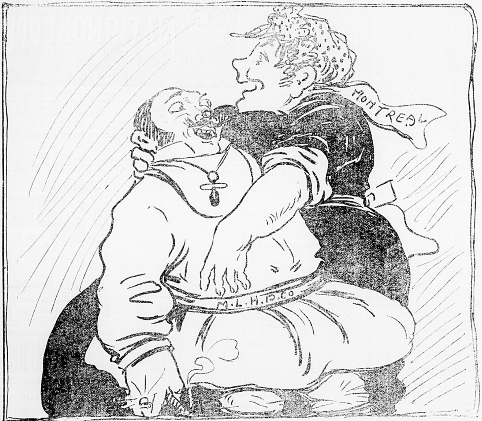
MONTREAL.—Je t'ai tellement gâté, que j'peux pas me décider à te sevrer.