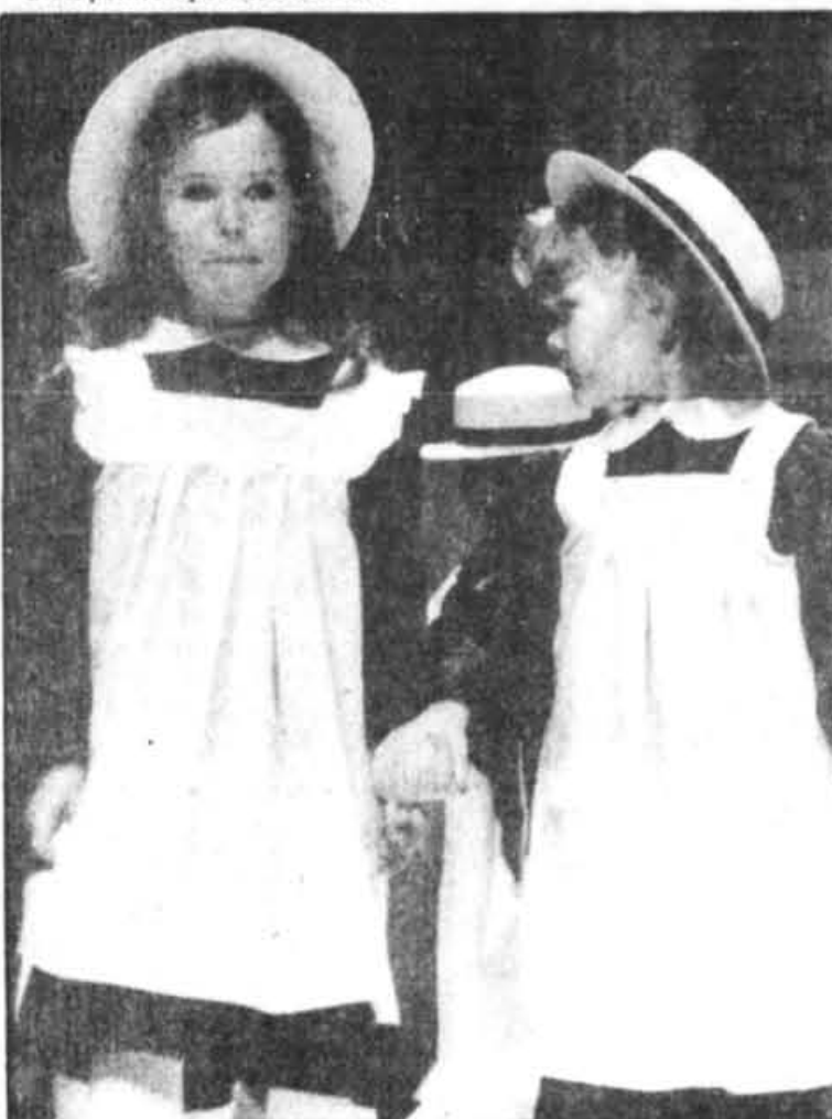
Des enfants aux petites robes bien sages qui ont défilé chez Eaton.