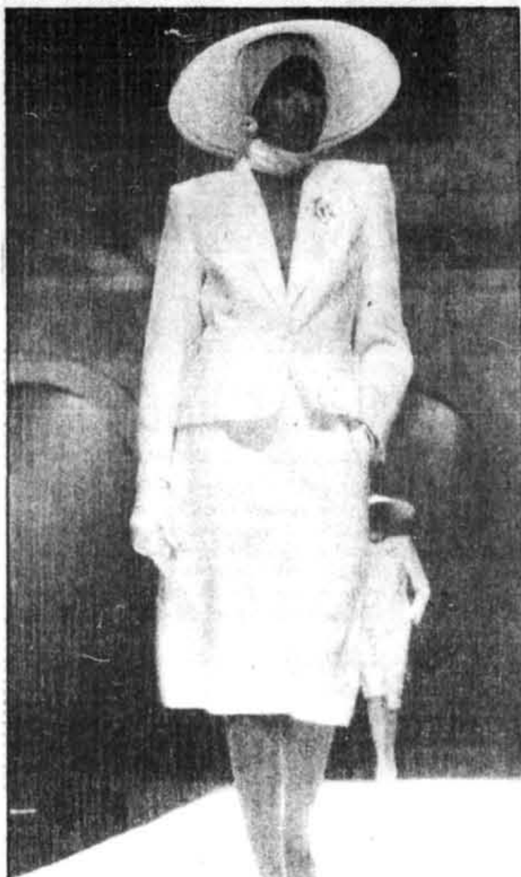
Un petit tailleur très strict, mais à la blancheur de l'été.

Les enfants d'abord, groupe blanc et marine, avec leurs jolis minois et leurs canotiers. Les grandes ensuite en blanc, pantalons, bermudas, jupes, vestes, corsages, grandes chemises d'artistes, beaucoup de maille et beaucoup de fibres synthétiques. Des couleurs acidulées, des imprimés, tout ce qui fait la mode d'un printemps international.