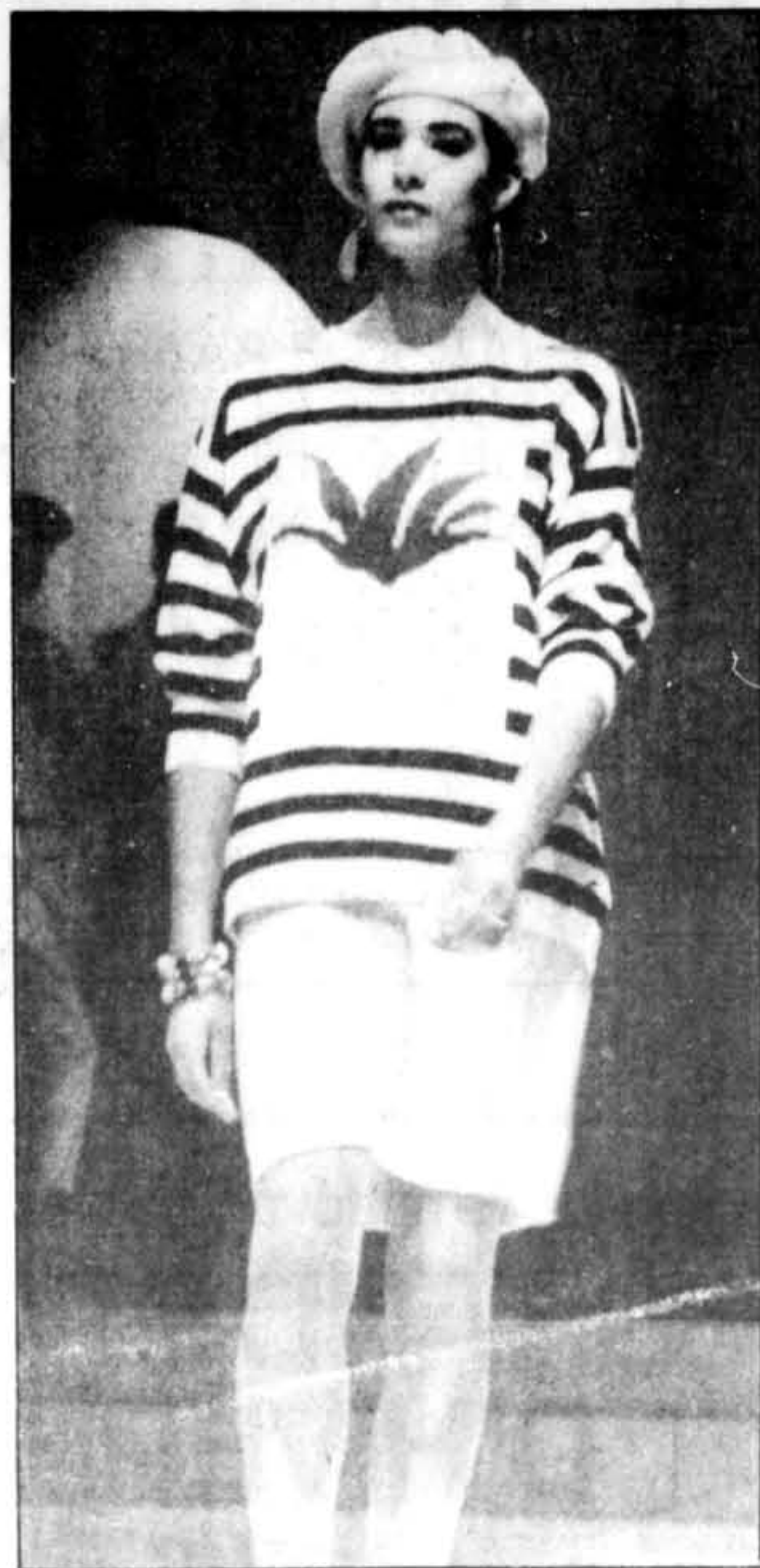
Des coordonnés de tricot très confortables pour l'été.

LIGNES D'HORIZONS NOUVEAUX. LES TOILES ARGENTÉES DES NOUVEAUX TAILLEURS MARC CAIN, POUR S'ÉVADER HORS DU BUREAU, HORS DE L'ORDINAIRE. JUPE FUSEAU À RABATS, 230 $. VESTE CROISÉE, 370 $. CES DEUX MODÈLES EN TAILLES 4 à 12. GILET LONG ET FIN, RÉVERSIBLE, DOUBLÉ D'UNE COTONNADE IMPRIMÉE MULTICOLORE. 240 $. TAILLES 6 à 12. LIN / TOILE / VISCOSE BEIGE. CACHE-CORSET EN COTON, MAUVE, PÊCHE OU OLIVE, 50 $. P / M / G. LES CRÉATEURS: 2e, CENTRE-VILLE ET FAIRVIEW.