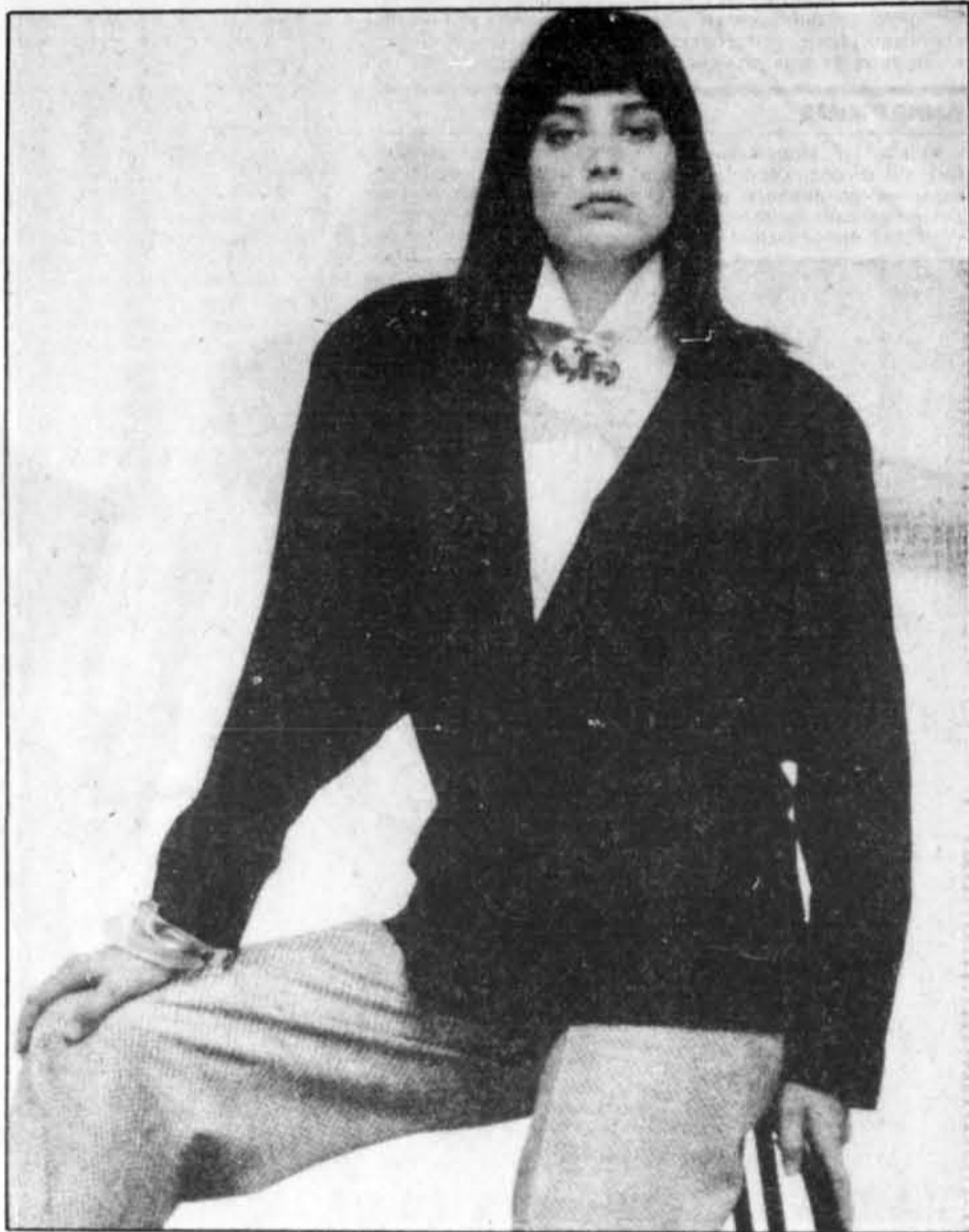
Pour femmes : une veste en pur lin noir texturé, portée sur un chemisier de coton blanc à col à pointes et un pantalon gris en soie et laine. Disponible chez Harry Rosen.

Les collections estivales vont assurément dans cette nouvelle ligne de pensée; plus mode, plus au goût du jour. Les couleurs, les tissus, surtout le lin, marquent l'évolution. Les coupes sont moins guindées, plus flatteuses; des signatures telles que Paolo, Da Barberino, comme Valentino pour les hommes, ajoutent à la variété des collections. Les vêtements se coordonnent, on peut même trouver toute une gamme d'accessoires.