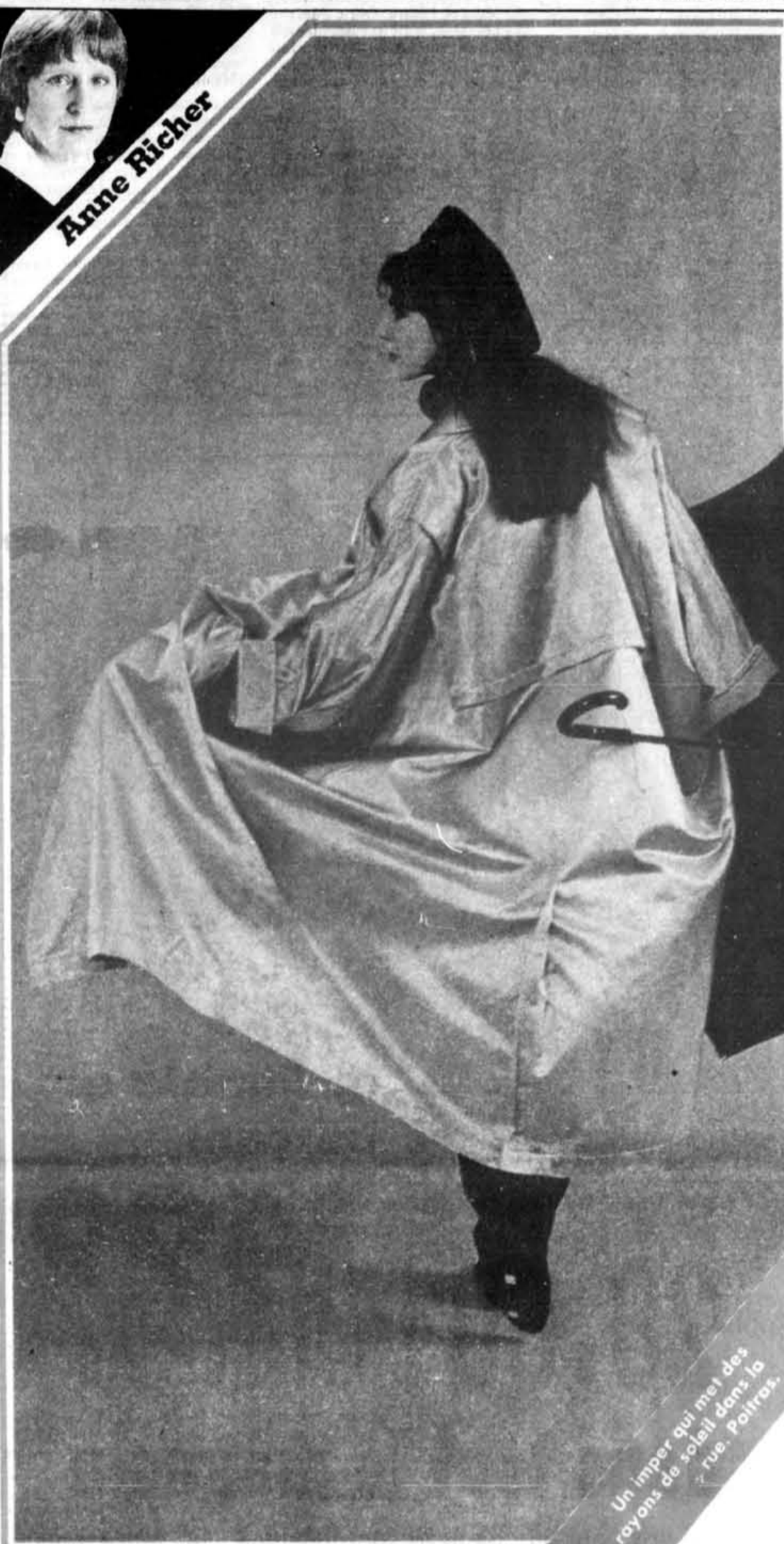
Un imper qui met des rayons de soleil dans la rue. Poitras.