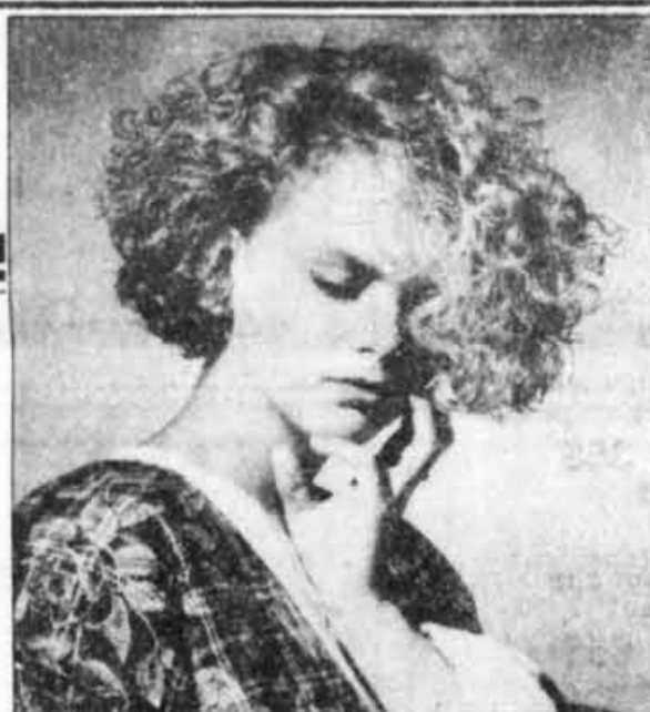
Coupe et Brushing $22 et plus au 400 boul. Dorchester seulement

vous en avez pour votre argent...et plus