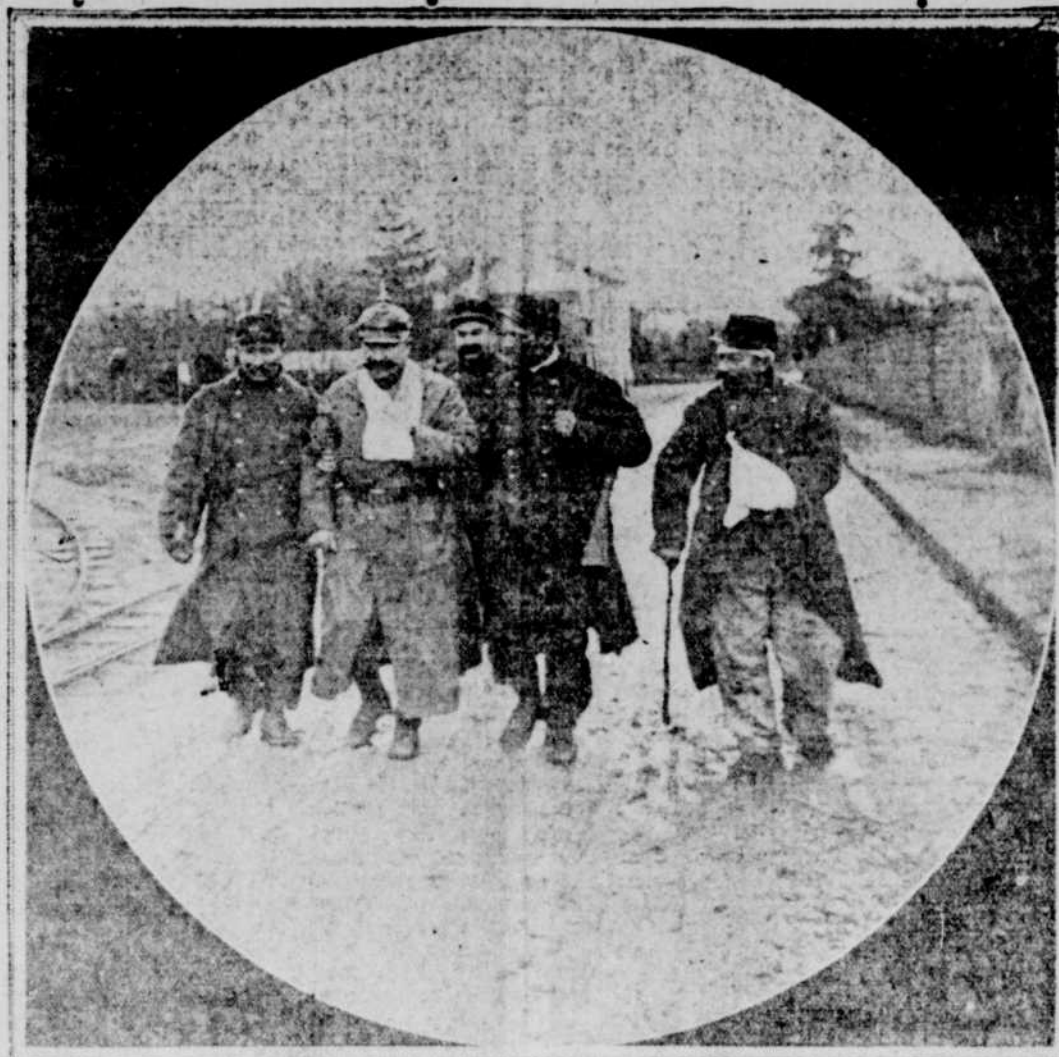
CETTE VIGNETTE REPRESENTE DES RESERVISTES FRANÇAIS E SCORTANT JUSQU'A LA PLUS PROCHE AMBULANCE UN SOLDAT ALLEMAND BLESSE.