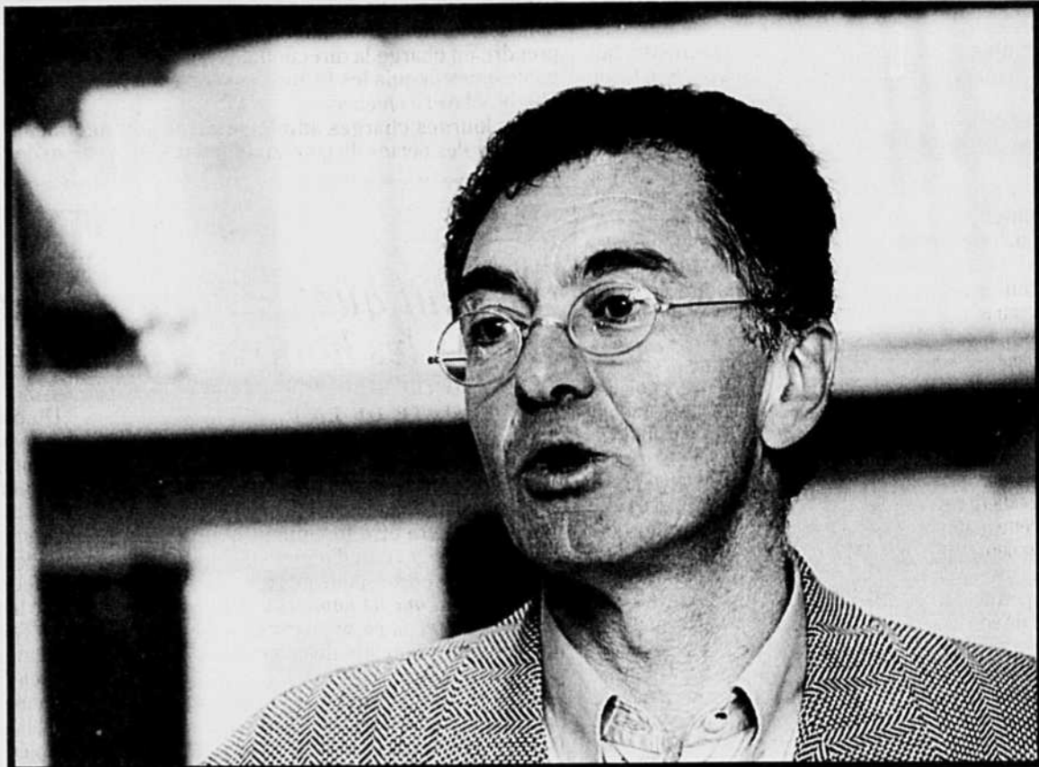
Gilles Lipovetsky: «Des aspects séculaires de l'ancienne condition féminine ont été liquidés en 20 ans grâce à l'extraordinaire efficacité de la révolution féministe, mais il n'y a pas pour autant une indifférenciation des sexes.»

«Le style, la cosmétique seront différents. Mais sur le fond, je ne crois pas», répond-il.