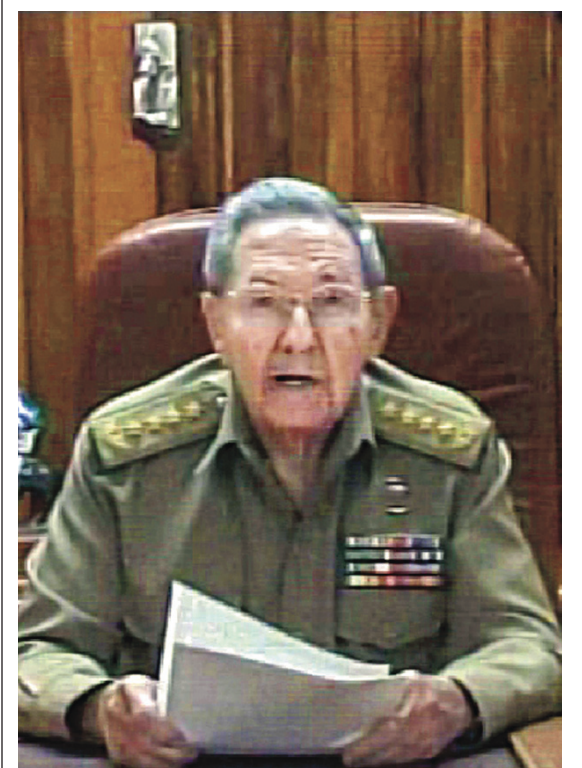
Raul Castro lors de son allocution télévisée à la nation cette semaine