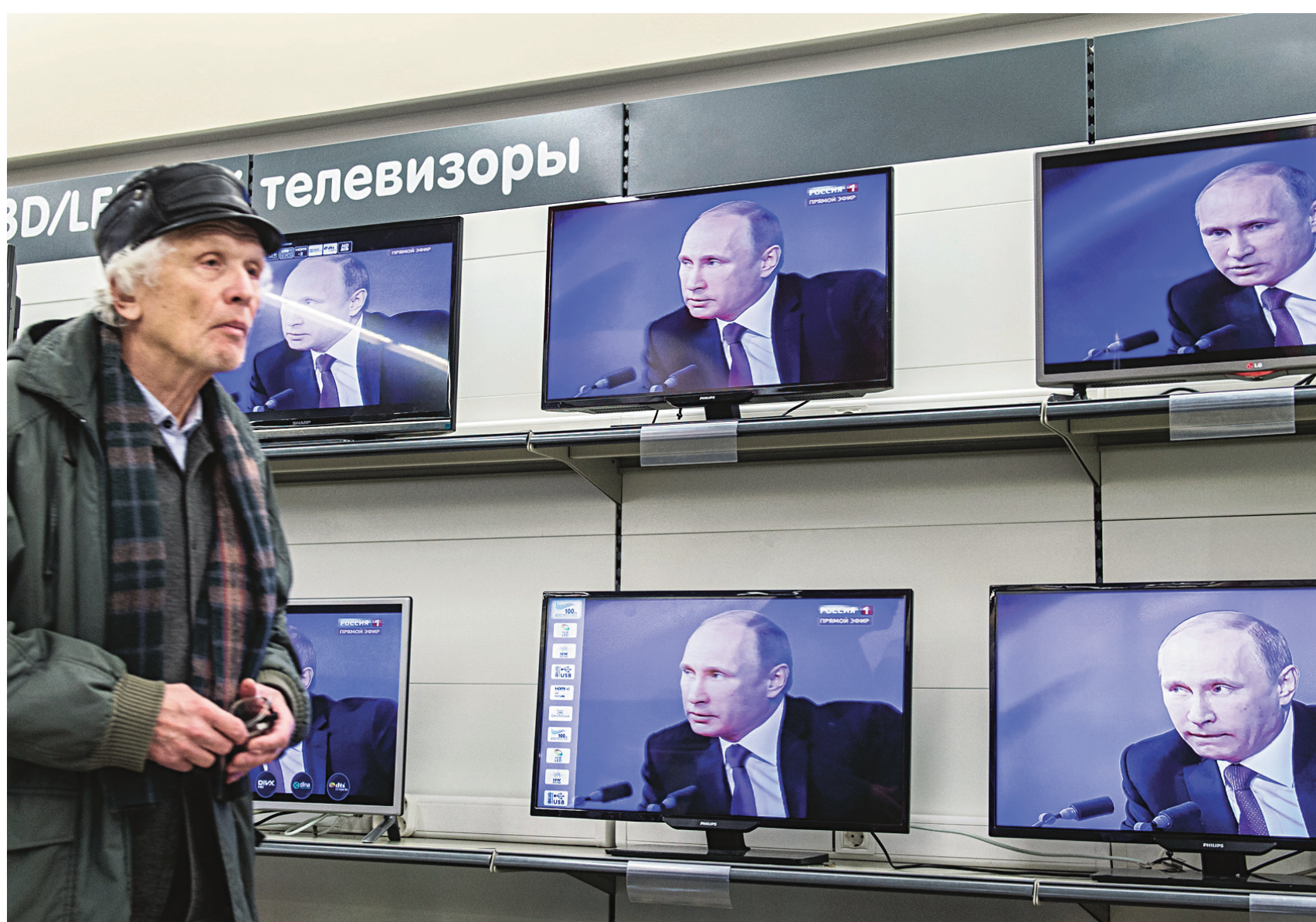
Comme chaque année, Vladimir Poutine a répondu cette semaine aux questions de la population lors d'une émission télé.