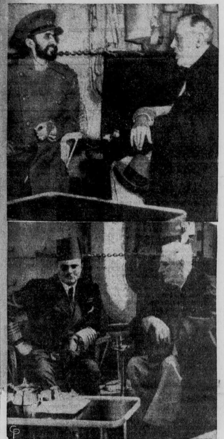
RECUS PAR ROOSEVELT : En haut, le président ROOSEVELT cause avec l'empereur de l'Ethiopie, HAILE SELASSIE, qui rencontrera le président des Etats-Unis en Egypte à la suite de la conférence de Crimée. En bas, c'est le roi FAROUK, d'Egypte, qui converse avec M. ROOSEVELT.

Les aviateurs russes, cependant, survolent constamment la côte de la Baltique et la baie de Dantzig pour attaquer tout navire allemand qui pourrait tenter de se rendre à Pillau.