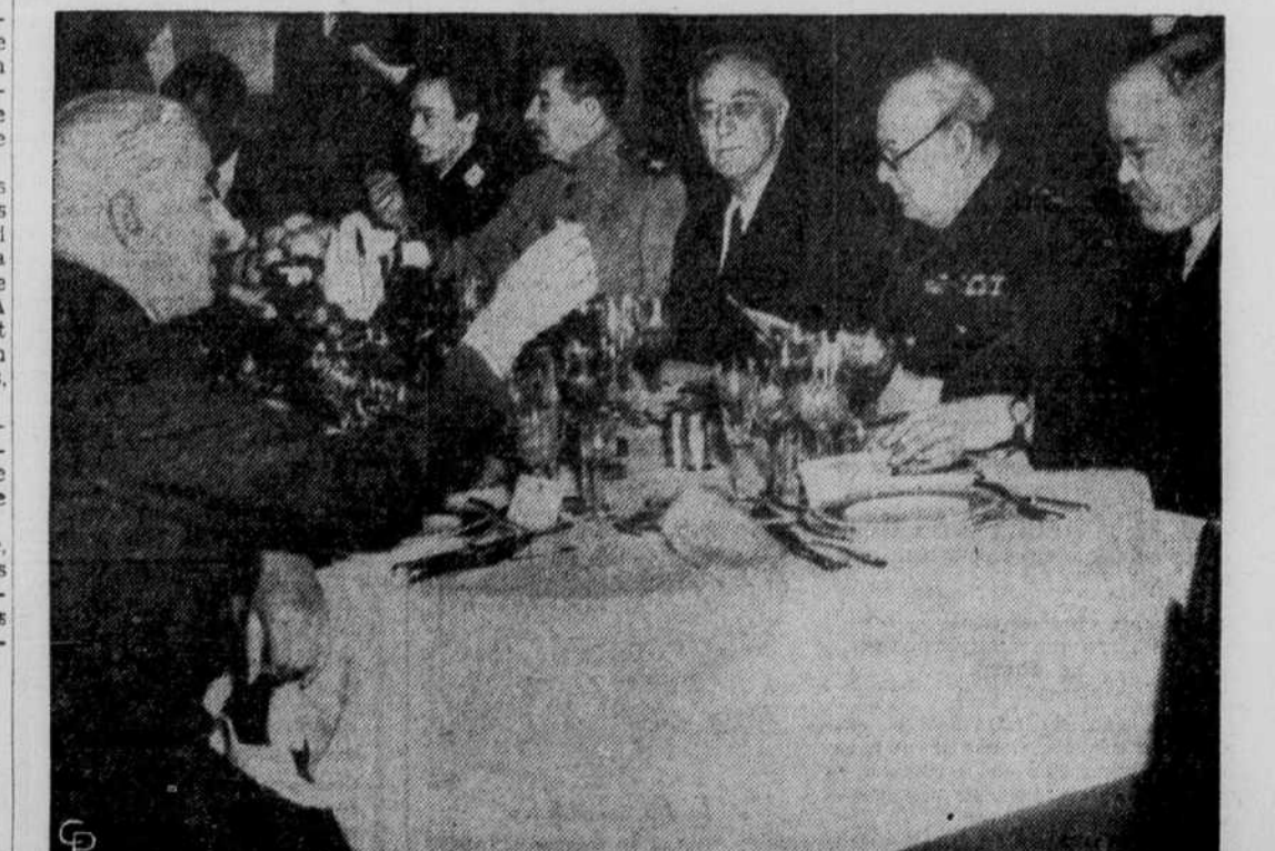
A LA CONFERENCE DE CRIMEE : Le président ROOSEVELT, le premier ministre STALINE et le premier ministre CHURCHILL sont photographiés au cours d'un dîner au palais Livadia à Yalta, au cours de la conférence de Crimée. On voit avec eux E. DE STETTINIUS, secrétaire d'Etat à Washington et V. MOLOTOV, commissaire des Affaires étrangères en Russie.