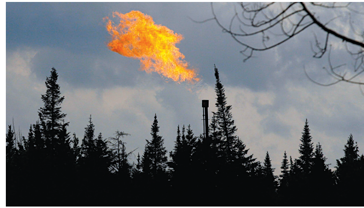
YAN DOUBLET LE DEVOIR

La société Talisman a dû cesser sa fracturation hydraulique en Pennsylvanie à la demande du ministère de l'Environnement de l'État à la suite d'une fuite survenue à son puits de Tioga.