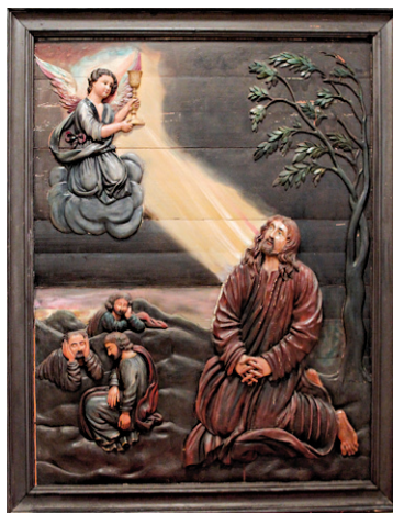
JACQUES GRENIER LE DEVOIR Un des bas-reliefs sculptés par Guérin dit Belleville

rence fondamentale entre une œuvre d'art qui est «classée» et une autre qui ne l'est pas. Pour celle qui l'est, on s'attendrait à ce que les autorités publiques fassent un «petit quelque chose» pour protéger l'intérêt «national» dans cette œuvre. Classer une œuvre d'art «bien culturel» comporte aussi une responsabilité publique de suivi.