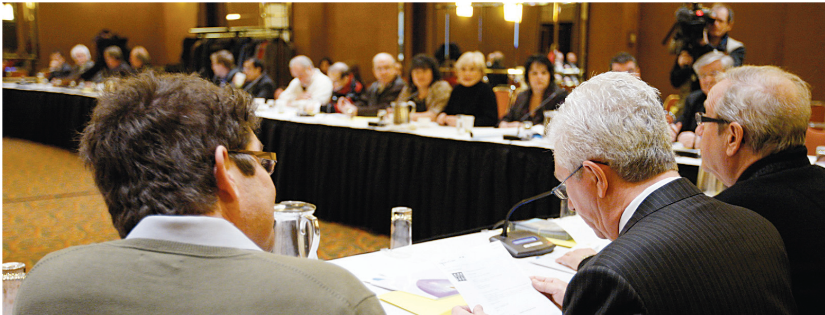
Le caucus du Bloc québécois était réuni hier à Québec.