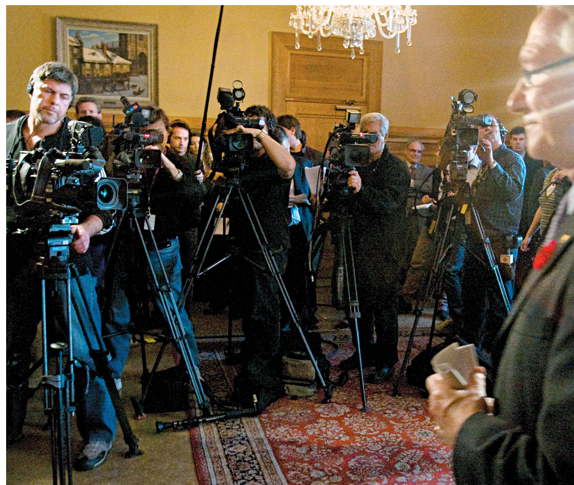
Des journalistes assistent à une conférence de presse du maire de Montréal, Gérald Tremblay. Dès le début des années 1970, l'accroissement de la concentration a soulevé des inquiétudes dans le milieu journalistique et, dans une moindre mesure, dans les milieux politiques, et la population canadienne et québécoise en général.

D'abord, le Québec ne dispose pas de tous les outils pour établir de telles règles, contrairement