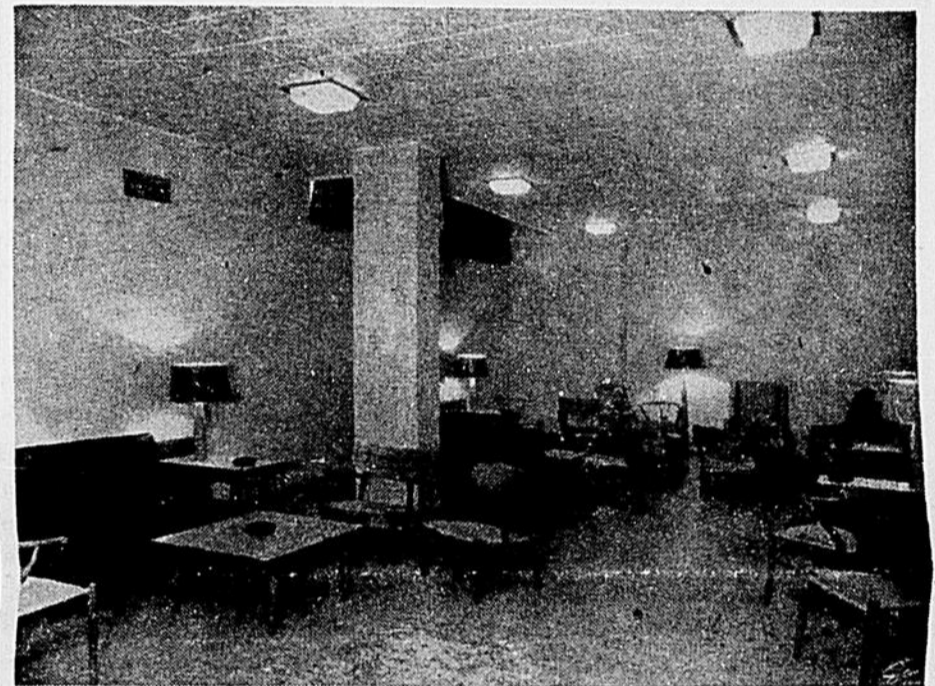
UN DES SALONS

Les chambres de notre "Centre" agréables, bien éclairées et confortables. Les meubles, sobres, sont égayés par des tissus et draperies multicolores. Tout est bien compris et à la portée de la main. Rien n'a été épargné; même pas l'"éponge",