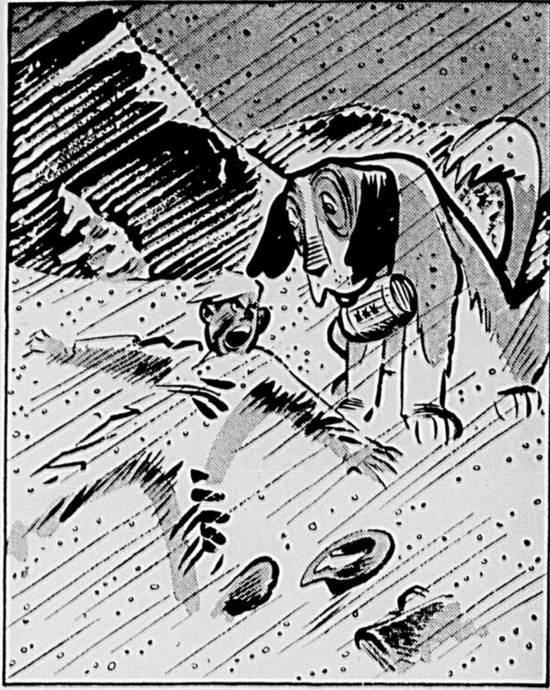
"Va t'en — je ne veux rien d'autre que des flocons Grape-Nuts délicieux et nourrissants!"

N'ayons que de bonnes intentions, et nous n'accomplirons, dès lors, que de saines actions !