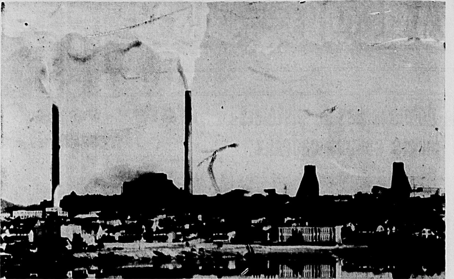
Noranda, une des principales mines de cuivre et d'or du Québec