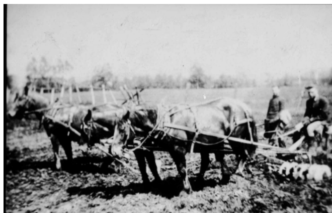
Travaux des champs exécutés par le nouveau colon

C'est donc dans ce contexte, que des hommes, des femmes et des enfants courageux ont tenté leur chance dans les cantons du Nord et peuplé un territoire qui, dans les faits, fut beaucoup moins accueillant que ce qu'on en disait dans les écrits de la propagande colonisatrice.