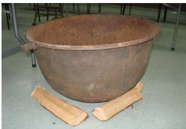
Chaudron utilisé pour la fabrication du savon