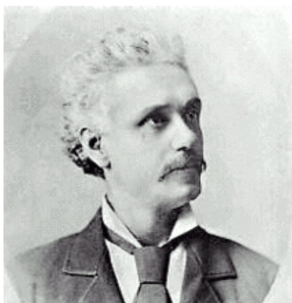
Arthur Buies, journaliste québécois, après s'être longuement opposé au clergé catholique, il s'est rallié à la cause de la colonisation du curé Labelle.

L'œuvre d'Arthur Buies mérite quelques instants de réflexion. Écrivain de renom, il a su présenter l'œuvre du curé Labelle avec une écriture qui a probablement inspiré plusieurs colons à tenter leur chance vers le Nord.