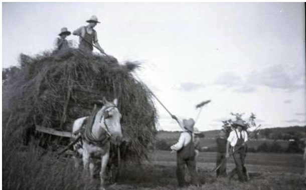
Récolte des foins.

Fin juin, c'est le temps des foins. Sa culture étant primordiale car c'est la principale alimentation des bêtes, manquer de foin amène à devoir vendre des animaux ou encore à l'acheter à fort prix. L'agriculteur s'assure d'abord que son matériel est en bon état (charrettes, faux, faucilles, râteaux et fourches) et attend que le foin entre dans sa phase de floraison avant de le couper, préférablement lors de journées chaudes et sèches. Parfois, la récolte s'organise en corvée entre voisins car les délais à respecter sont courts.