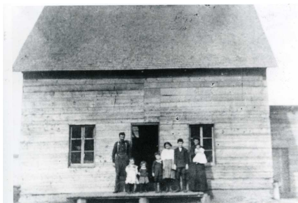
Exemple de maison de colons des Laurentides