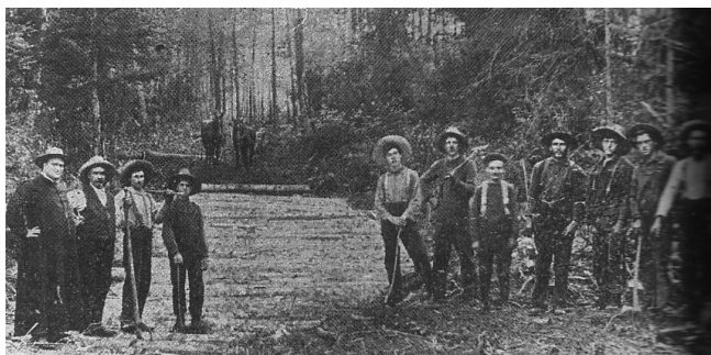
Ouverture d'un chemin de colonisation dans les Laurentides, vers 1900.

L'arrivée du chemin de fer change énormément le quotidien des colons. Pour les nouveaux arrivants, le train transporte aisément le mobilier, les biens personnels, les articles ménagers, la nourriture et les vêtements. Il devient aussi plus facile d'exporter les denrées agricoles périssables comme le lait, le fromage et le beurre.