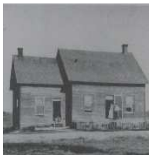
La maison et son fournil à gauche

Le fournil, ou cuisine d'été, est une annexe à la maison principale. Sans fondation et sans portes doubles, elle n'a pas l'isolation de la maison. Généralement rustique et peu décoré, le fournil est garni de vieux meubles usés. Condition climatique oblige, il est utilisé pendant l'été pour mieux supporter la chaleur saisonnière. Toute la vie quotidienne s'y déroule alors jusqu'à la venue de la nuit où les habitants regagnent la maison pour le repos. En hiver, il sert de chambre froide pour la conservation des denrées alimentaires et de remise pour les pelles, raquettes et traîneaux.