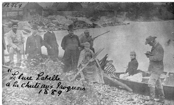
Le Curé Antoine Labelle, à la Chute aux Iroquois (Labelle), 1889

francophones. À son arrivée, la colonisation du nord va bien mal. Les nouvelles paroisses ont une économie stagnante et la région connaît un léger dépeuplement malgré les efforts de la colonisation.