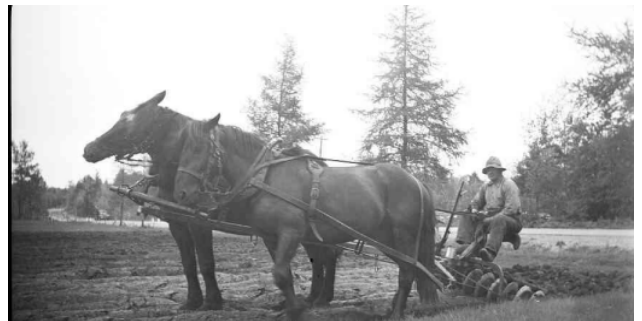
Travaux de labourage avec herse

Le labourage consiste à tracer des sillons profonds dans la terre afin de permettre son aération et pour enfouir le fumier dans le sol. Il est fait grâce à un charrue tirée par des chevaux ou des bœufs et préférablement effectué dans le sens de la plus grande dimension du terrain afin d'éviter de retourner trop souvent la charrue. Par la suite, le colon passe une herse afin de briser les mottes de terre et niveler le sol. Le cheval est une aide précieuse pour ce travail mais coûte cher puisqu'il est estimé à 200$. Les bœufs moins fragiles et moins capricieux quant à leur alimentation que les chevaux, ils sont une bonne alternative. Ils sont plus forts, plus endurants et coûtent moins cher à l'achat. De plus, un bœuf estropié peut être engraisé et utilisé comme animal de boucherie.