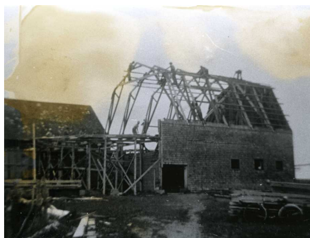
Corvée pour la construction d'une grange

Le jour de la corvée, les travailleurs se pointent avec leurs outils, les tâches sont expliquées puis réparties selon les aptitudes de chacun. La corvée ne dure généralement qu'une journée et vise à accomplir ce qui ne peut pas être fait seul, comme