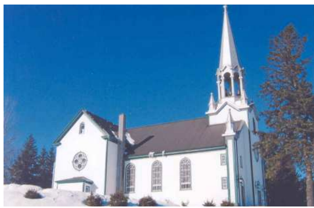
L'église en 2012

L'église est bâtie en bois sur une colline verdoyante, d'une grandeur de 120' x 54', haute de 40 pieds. Le clocher central est surmonté d'une croix métallique de 14'.