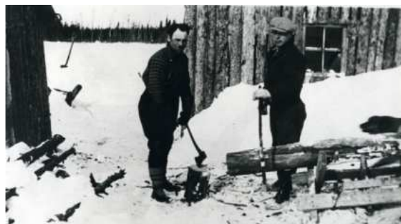
Coupe du bois de chauffage pour l'hiver

Pendant l'Avent ou après les fêtes, le colon se rend sur ses terres à bois pour abattre et ébrancher les arbres qui vont servir de combustible. Le bois est sorti de la forêt et placé sur le mur de la grange. Au printemps, ces arbres sont sciés en section de 45 à 60 cm puis fendus en deux, quatre, six ou huit quartiers. Plus le bois est gelé, mieux il se fend. Cette tâche doit être accomplie, au plus tard, avant le début mars.