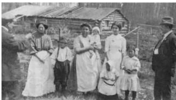
Des colons avec un agent des terres, en Abitibi

Ce discours a été repris par le gouvernement du Québec. Hormidas Magnan est l'auteur de Monographies paroissiales; esquisses des paroisses de colonisation de la province de Québec , publiée par le département de Colonisation en 1913. Cet ouvrage présente des paroisses de colonisation et leurs besoins. Dès la première phrase de la préface, le ton est donné :