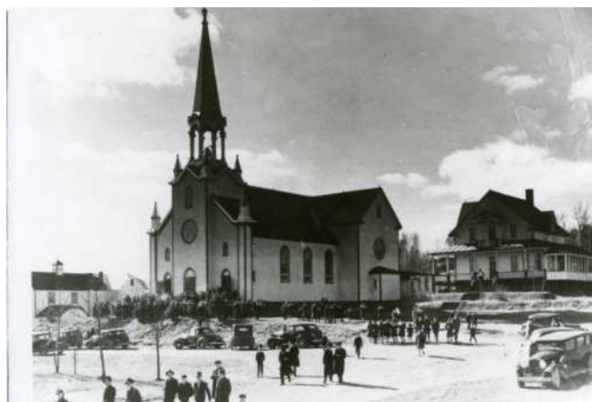
L'église et, à sa droite, le presbytère