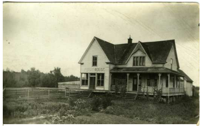
La ferme Rouge

Dans la vallée de la Lièvre, c'est la Compagnie James Maclaren de Buckingham qui fonda la ferme Rouge située dans le Canton Kiamika, la Ferme Neuve, la Ferme Wabasse (Saint-Aimé-du-Lac-des-Iles), la ferme Tapanee (Sainte-Anne-du-Lac). Ces fermes furent ensuite achetées par des nouveaux colons et ont formé les villages et municipalités qui existent encore aujourd'hui.