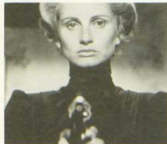
C'est arrivé... entre midi et trois heures

Quand Graham revient, Amanda ne peut affronter l'idée de détruire la légende. Il ne restera plus au faux héros qu'à errer à la vaine recherche de son identité.