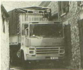
Impossible... pas français