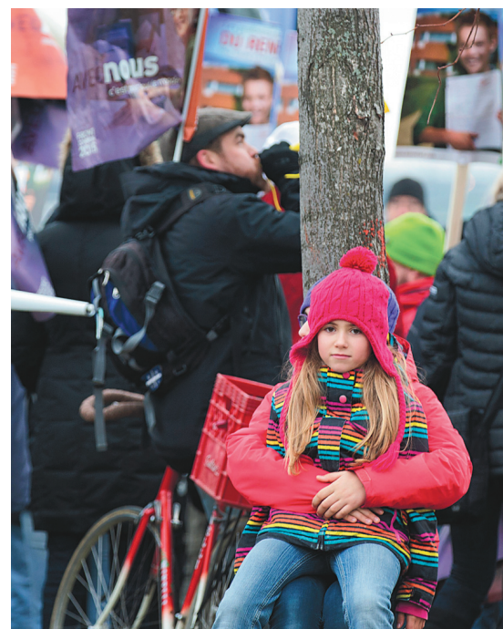
Les enseignants de la FAE, qui ne fait pas partie du Front commun, manifestaient aussi.