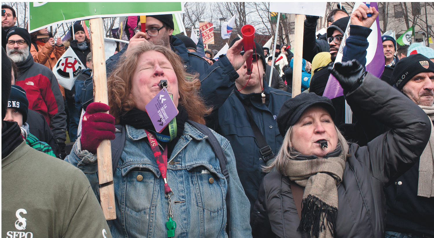
Selon leurs estimations, les employés du secteur public ont tenu mercredi la plus importante journée de grève depuis 1972.