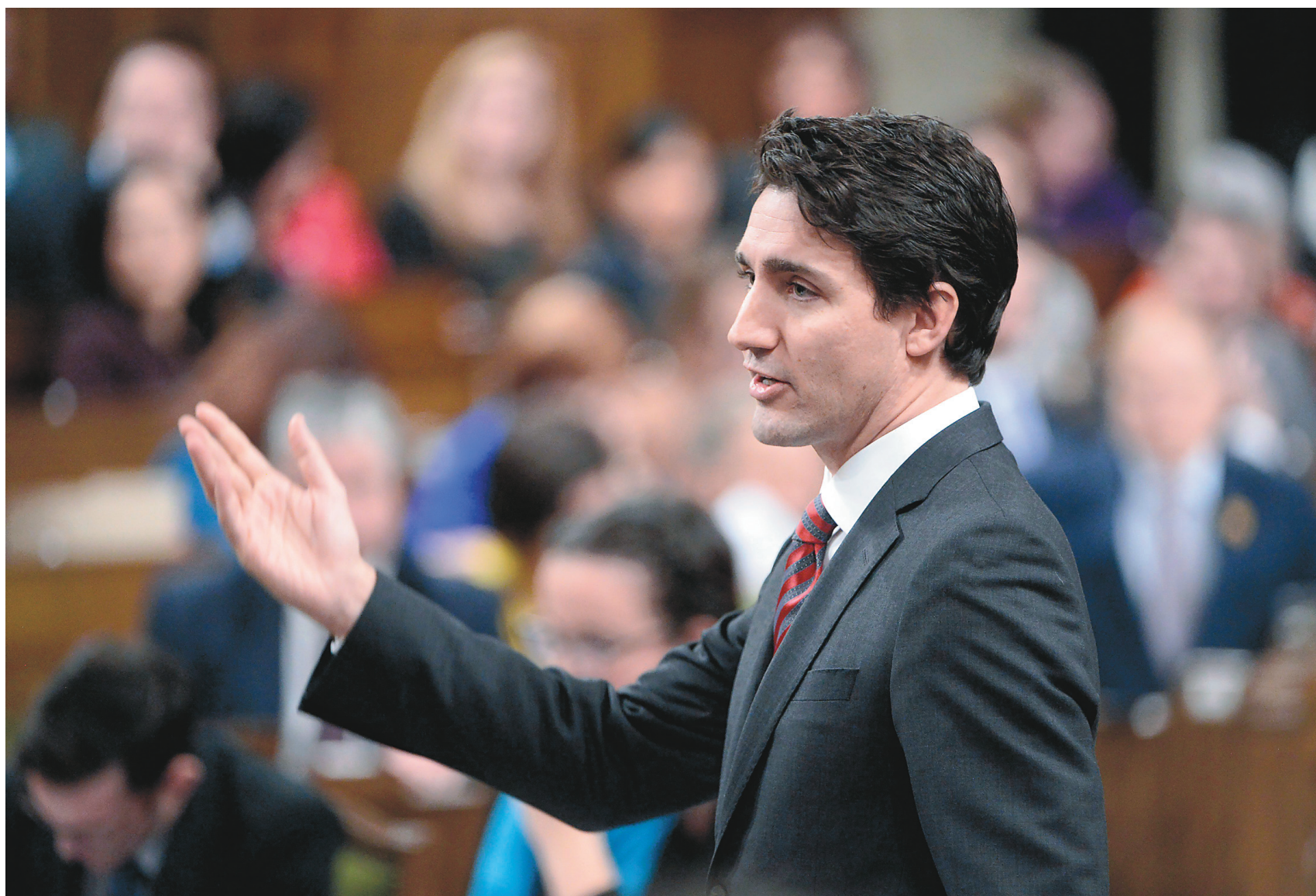
ADRIAN WYLD LA PRESSE CANADIENNE

Rappel : Depuis vingt ans, mes bulletins de fin de session omettent volontairement d'attribuer une note au premier ministre et au chef de l'Opposition officielle, dont j'analyse le travail à longueur d'année et auxquels il me faudrait consacrer beaucoup plus d'espace que celui dont je dispose dans ces bulletins.