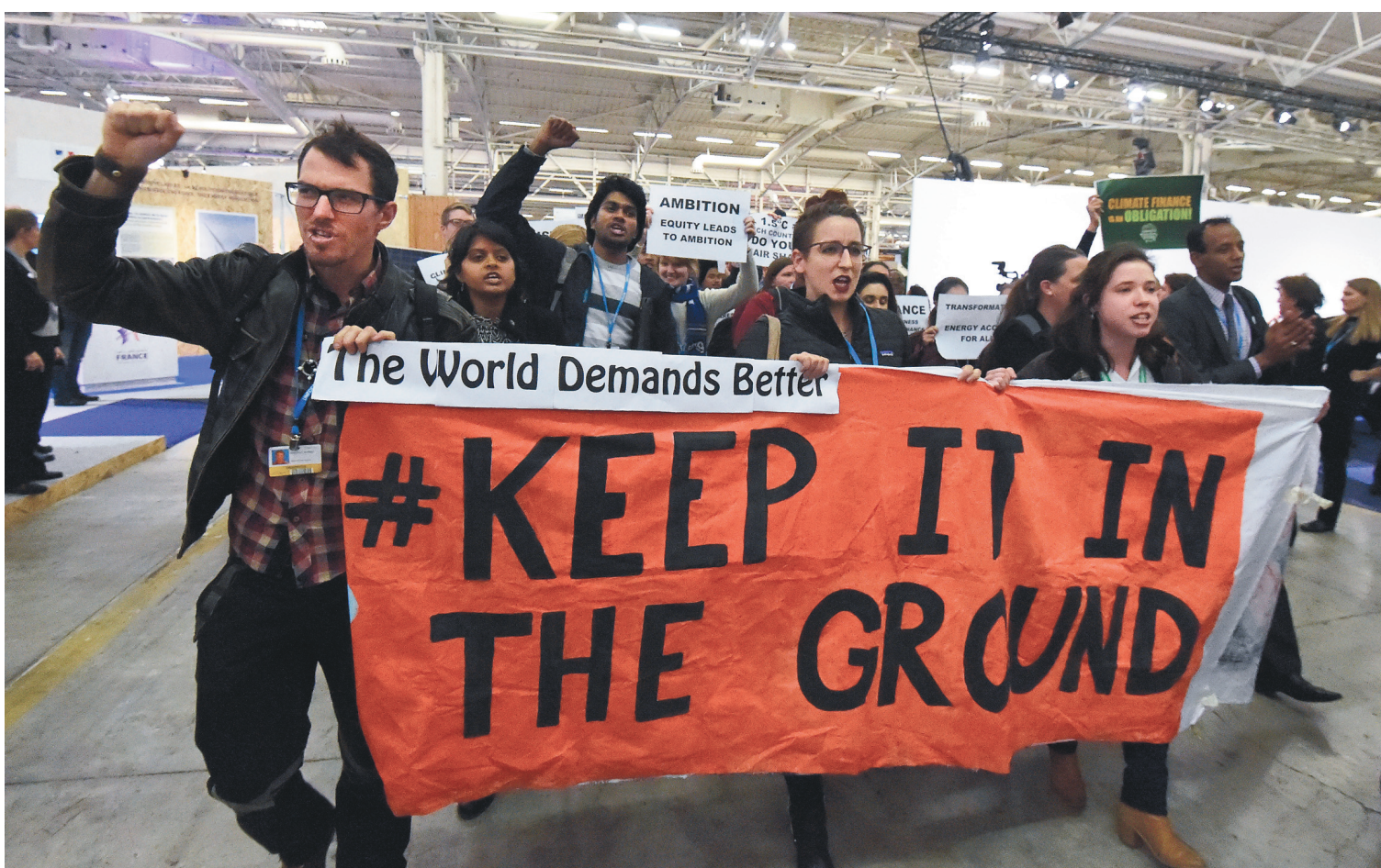
Des manifestants ont demandé aux participants de la COP21 de cesser d'investir dans l'exploitation des énergies fossiles.