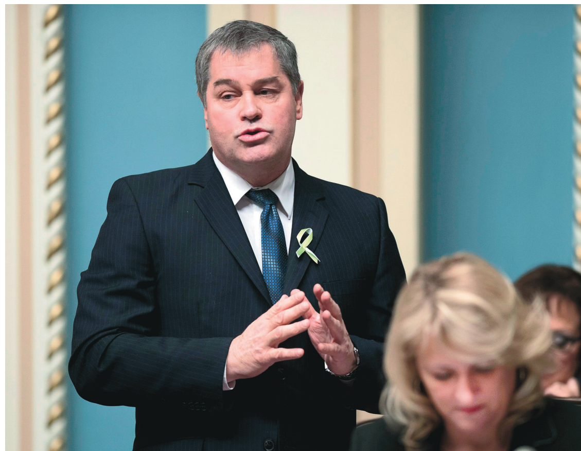
JACQUES BOISSINOT LA PRESSE CANADIENNE

Mais cela, c'est seulement s'ils ont occupé leur fonction pendant «au moins un an», ce qui n'est pas le cas de M. Bolduc (10 mois). Le bureau du Commissaire au lobbyisme a toutefois confirmé au Devoir que l'article 29 (qui cible plus précisément les activités de lobbyisme auprès de l'institution