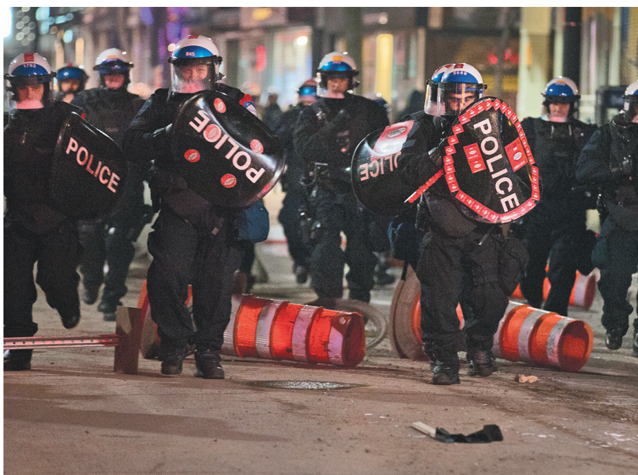
En soirée, une autre manifestation contre l'austérité a donné lieu à des arrestations. Des gaz lacrymogènes ont aussi été utilisés.