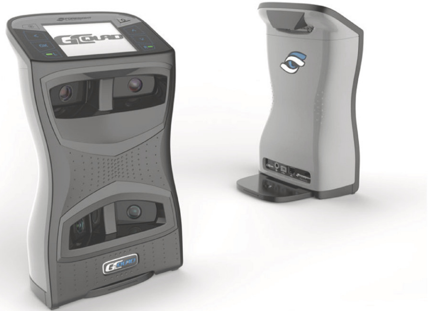
Le performant appareil Foresight GC Quad analyse votre élan et offre des données vraiment précises.

Alors, n'attendez plus et prenez un rendez-vous avec l'un des trois experts du laboratoire. Lors de votre rencontre, il analysera votre élan, votre morphologie et vos besoins en matière de bâtons. Pour effectuer cette analyse, l'équipe utilise le Foresight GC Quad, un appareil à la fine