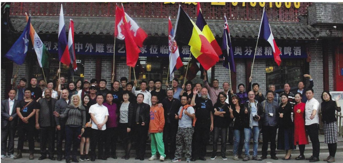
Les membres d'ISSA en visite à Harbin, en Chine

Le Conseil de la Sculpture est membre d'ISSA, une organisation sans but lucratif qui fait la promotion de la sculpture et des symposiums de sculptures. ISSA regroupe une soixantaine d'organismes provenant de plus de 40 pays et son siège social est basé à Beijing.