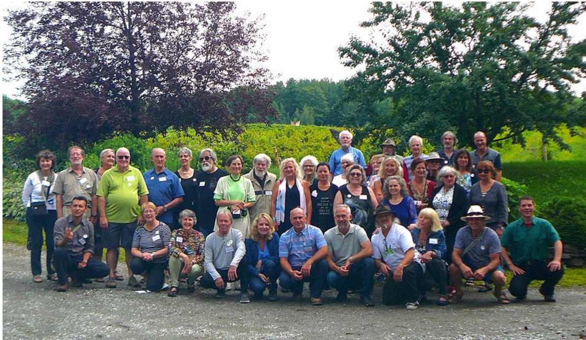
Les sculpteurs exposant à Nature et Création lors du vernissage, le 15 juillet 2017.

La 17 e édition de l'exposition de sculptures monumentales « Nature et Création » a eu lieu au Vignoble des Côtes d'Ardoise de Dunham, du 15 juillet au 25 octobre 2017, sous la présidence d'honneur de M. Pierre Janecek, maire de Dunham. Cette exposition réunit une centaine d'œuvres extérieures exposées dans un décor champêtre et une centaine de petites œuvres en boutique.