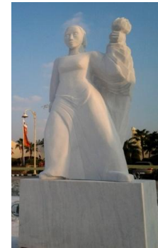
L'Éveil de la Conscience, œuvre en marbre de Marie-Josée Leroux, Égypte

Le Caire – 4 th Madinaty International Sculpture Symposium Novembre 2017. Elle a réalisé une œuvre en marbre de 3,5 m.