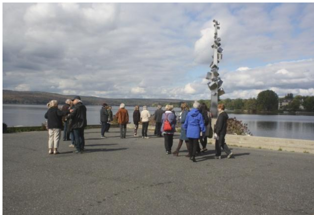
L'Œuvre de Jean-Yves Côté

Les 48 œuvres réalisées sont installées à travers la ville.