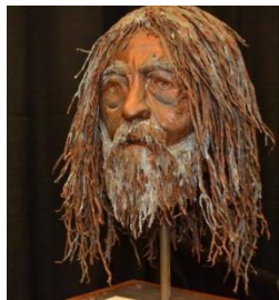
Œuvre de Pierre Trahan