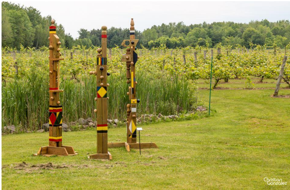
L'œuvre de Pierre Dupras au Vignoble Côte de Vaudreuil