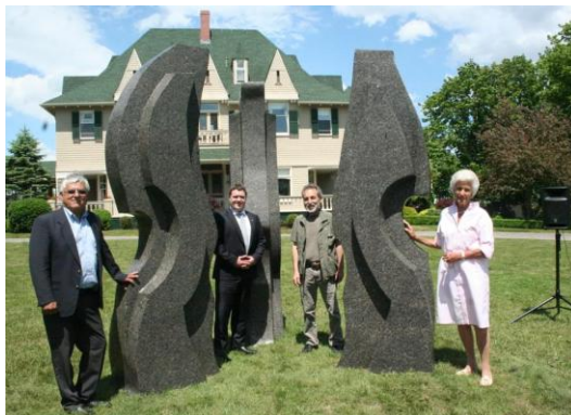
L'œuvre de Domenico Di Guglielmo

Elle a été installée devant le Kingsbrae international Résidence for the Arts à Saint Andrews au Nouveau-Brunswick, le 1 er juillet 2017.