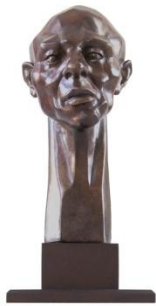
Bronze de Philippe Coudari