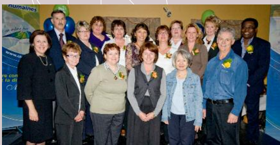
Enseignants du primaire