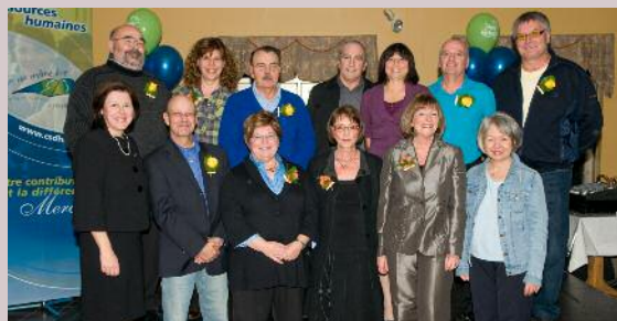
Enseignants du secondaire