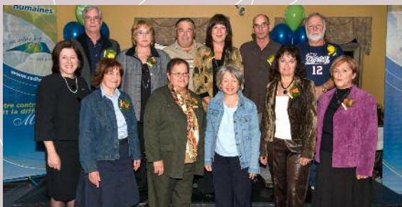
Personnel de soutien

Voici les photos de quelques-uns de ces retraités.