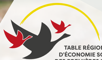
TABLE RÉGIONALE D'ÉCONOMIE SOCIALE DES PREMIÈRES NATIONS