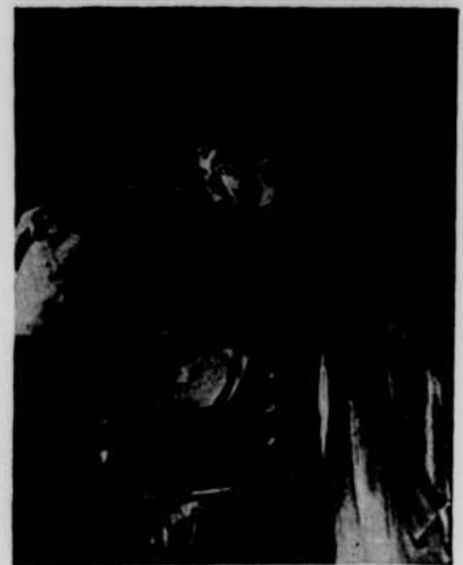
GIULIO NERI, célèbre basse de l'opéra de Milan dans le rôle de Mefistofele.