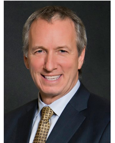
Le ministre de l'Agriculture, des Pêcheries et de l'Alimentation

Pour terminer, je vous assure que nous allons suivre avec attention et intérêt le déroulement de la prochaine saison de pêche, dont le début approche, et que nous travaillerons avec vous afin de trouver des solutions aux différents défis qui se dressent devant vous.