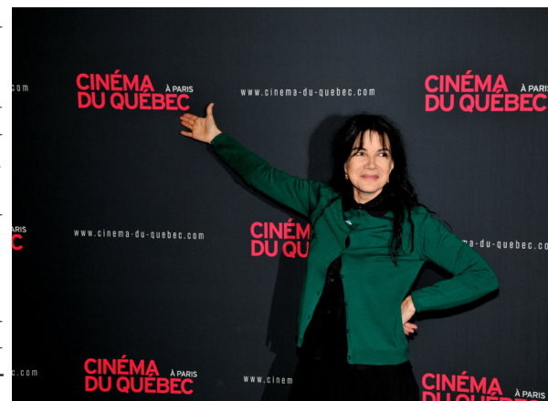
Carole Laure, présidente d'honneur de Cinéma du Québec à Paris depuis ses débuts, lors de la soirée d'ouverture de l'événement, le 26 novembre, au Forum des images, Paris.